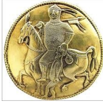
Görsel 8. Atlı Savaşçı Figürü, Vazo Betimi (2 nolu Sürahi), Altın, Peçenekler, Nagyzentmiklos Hazinesi (Berkli, 2011)

sonlanmakta ve omuzlarından yükselerek içe doğru kıvrılanlar kanat veya fantastik hayvan figürü olmalıdır (Görsel 7). Figürün elinde tuttuğu insan başı, ilerleyen dönemlerde Türk Sanatında kullanılacak savaştan galip gelen alpi simgelemektedir. Figürün elindeki insan başının Pers kralına ait olabileceği, dolayısıyla İskit hatunu Tomris'in kazandığı galibiyeti veyahut ilahi bir varlığı simgelediği düşünülmektedir.