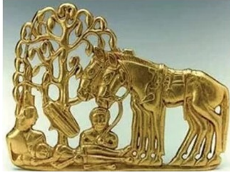
Görsel 10. Bir Ağacın Altında Atlarıyla Dinlenen İskitler, Kemer Tokası, Altın, Hun Dönemi (M.Ö. 4.-3. Yüzyıl), Sibiryaya, St. Petersburg Hermitage Müzesi. https://www.fikir.gen.tr/wp-content/uploads/2018/06/Resim.-01.04-Alt%C4%B1n-levha-A%C4%9Fa%C3%A7-alt%C4%B1nda-atlar%C4%B1yla-dinlenen-%C3%BC%C3%A7-ki%C5%9Fi-Ermitage-M%C3%BCzesi.png (Erişim Tarihi: 01.12.2021).

üzerinde tekrarlanmış olup muhtemelen sevgili veya eş olduklarını, aralarındaki sevgi bağını simgelemektedir.