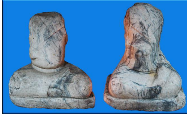
Görsel 18. Bilge Kağan ve Eşine Ait Heykeller, Mermer, Göktürk Dönemi (8. Yüzyıl), Millî Tarih Müzesi-Moğolistan (Alyılmaz & Alyılmaz, 2014)

Erken döneme ait ölüm ve defin ritüelleri, cinsiyet bakımından incelenmesi gereken bir alandır. Hun dönemine ait arkeolojik veriler, kurganlardan çıkmış olup II. Pazırık kurganında kadın ve erkek cesetleri tahnid edilmiştir (Çoruhlu, 2017, s. 92; İnan, 1987, s. 508; Diyarbakirli, 1972, s. 65). Her iki ölü bir tabuta konulmuş, kadının cesedi üzerinde zorla öldürüldüğüne dair ize rastlanılmamıştır (İnan, 1987, s. 508). Aynı dönemde Ukok'ta bir kadın cesedi üzerinde hayvan dövme bulunmaktadır (Çoruhlu, 2017, s. 94). Hun döneminde asil ve alp kişilere dövme yaptırılması (Diyarbakirli, 1972, s. 60; Berkli, 2011, s. 48), erkek ve kadınların asker-savaşçı yönünü yansıtmaktadır. Ayrıca bu kurganın sadece bir kadına ait olması (Çoruhlu, 2017, s. 113), yalnızca erkeğe veya kadına kurgan yapılabildiğini göstermesi sebebiyle önemlidir. İlaveten IV. Pazırık (Çoruhlu, 2017, s. 97), V. Pazırık (Çoruhlu, 2017, s. 98; Diyarbakirli, 1972, s. 23), Başadar (Çoruhlu, 2017, s. 100), Katanda (Çoruhlu, 2017, s. 106), Ulandırık/Ulandryk (Çoruhlu, 2017, s. 117), Arzhan (Çoruhlu, 2017, s. 114) kadın ile erkek cesetlerinin birlikte bulunduğu kurganlardır (Çoruhlu, 2017, s. 152).