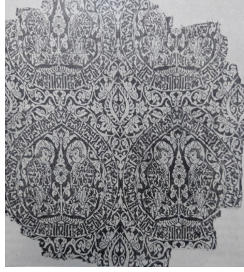
Görsel 23. İpekli Kumaş Parçası, Büyük Selçuklu Dön. (XI. Yüzyıl), Victoria-Albert Müzesi (Aslanapa, 2016)