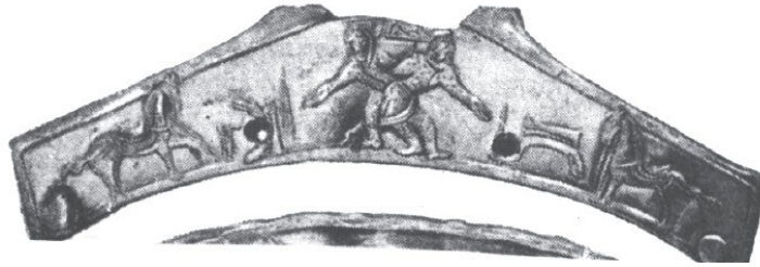
Görsel 6. Bamsı Beyrek ile Banu Çiçek Nişan Güreşi tasviri, Gümüş tabak, VII-VIII. yüzyıl. (Esin, 1991)

Türk kadınları, binicilik hususunda da erkekler gibi mahir olup (Gökalp, 2017, s. 339; Doğramacı, 1992, s. 4) söz konusu meziyetleri sanat eserlerine de aksetmiştir. Görsel 4'te verilen bir duvar resminde düğün alayında, atlı genç kızlardan bir bölük tasvir edilmişti (Esin, 1991, 474). Dikey eksenle birbirine paralel olarak sıralanmış eyerlerinden tuttıkları atları ile 3 adet kadın figürü kompozisyonu oluşturmaktadır. Bu kompozisyona benzer Pencikent'teki bir başka tasvirde, atlarıyla giden bir Göktürk beyi ve hanımının tasviri bulunmaktadır (Salman, 2011, 22). Figürlerin herhangi bir cinsiyet ayrımı gözetilmeksizin birlikte ata bindikleri görülmektedir.