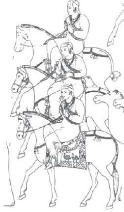
Görsel 4. Atlı Kadın Figürleri, Afrasyab Sarayı Duvar Resmi (Güney Duvarı) (Esin, 1991)