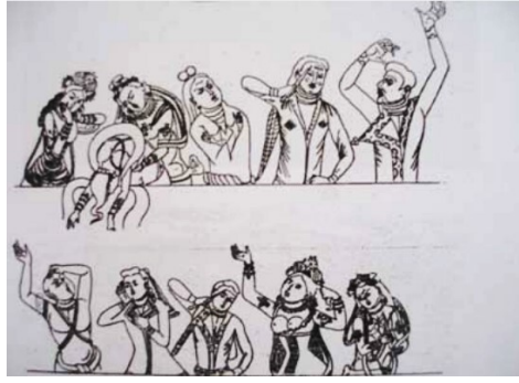
Görsel 19. Yoğ (matem) Töreni, Kaya Resmi, Göktürk Dönemi, Koço (Uzun, 2009)