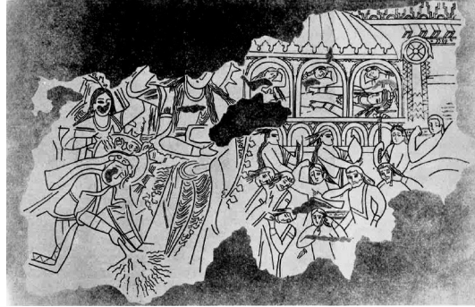
Görsel 20. Cenaze Töreni, Duvar Resmi, Göktürk Dönemi (7-8. yüzyıl), Pencikent Sarayı (Cezar, 1977)

Göktürk dönemine ait yukarıdaki duvar resimlerinde figürlerin eski Türklerle özgü ölüm ardından matem imgeleri olan saçlarını ve yüzlerini kestikleri an betimlenmiştir (Potapov, 1996, s. 215; Uzun, 2009, s. 96; Can, 2008, s. 169; Çoruhlu, 2017, s. 194). Göktürk Dönemine ait bir kaya resminde betimlenen on figürden sekizi erkek, ikisi kadındır (Görsel 19) (Uzun, 2009, s. 96). Cenaze töreninin betimlendiği bir diğer duvar resminde ise sol alt köşesindeki eğilmiş yere sıvı dökmekte olan kadın, muhtemelen cenaze merasimi için saç saçmaktadır (Görsel 20) (Uzun, 2009, s. 92). Yukarıdaki görsellerde giyim ve anatomik yapıları haricinde herhangi bir ayırım gözetilmeksizin betimlenen figürler, kadınların erkeklerden kaçmadıkları ve aynı ortamda ritüele katılabildiklerini göstermektedir.