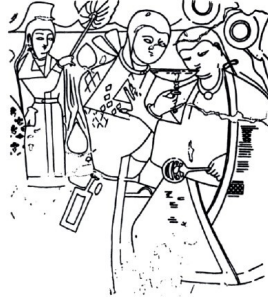
Görsel 11. Uygurlu Bir Çiftin Düğün Merasimi, Uygur Dönemi (7-8. yüzyıl). (Esin, 1991)

Prototürk veya Hun dönemine ait diğer eser, bir kemer tokasına aittir (Görsel 9) (Çoruhlu, 2017, s. 141). Günlük hayattan sakın bir köy manzarasının işlendiği eser üzerinde ağaç altında yerde sevgilisinin dizine yatmış uyuyan süvari, arkada iki atı dizginlerinden tutmuş bekleyen bir seyis figürü işlenmiştir. Türk tipini yansıtan figürler ile atlar oldukça karakteristiktir (Aslanapa, 1973, s. 22; Uzun, 2009, s. 86). Sevgilisi veya eşinin dizine uzanmış dinlenen erkek, eserde ilk dikkat çeken imge olup bu anın altın madeni ile işlenerek sanat eserine konu edilmesi, muhtemelen çiftler arasındaki sevgi bağının ölümsüzleştirilme isteğini yansıtmaktadır.