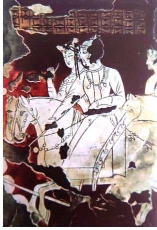
Görsel 5. Pencikent Sarayı, Türk Beyi ve Hanımı Duvar Resmi, Göktürk dönemi, 7-8. Yüzyıl, St. Petersburg Ermitage. (Salman, 2011)

Türk kadınları, binicilik hususunda da erkekler gibi mahir olup (Gökalp, 2017, s. 339; Doğramacı, 1992, s. 4) söz konusu meziyetleri sanat eserlerine de aksetmiştir. Görsel 4'te verilen bir duvar resminde düğün alayında, atlı genç kızlardan bir bölük tasvir edilmişti (Esin, 1991, 474). Dikey eksenle birbirine paralel olarak sıralanmış eyerlerinden tuttıkları atları ile 3 adet kadın figürü kompozisyonu oluşturmaktadır. Bu kompozisyona benzer Pencikent'teki bir başka tasvirde, atlarıyla giden bir Göktürk beyi ve hanımının tasviri bulunmaktadır (Salman, 2011, 22). Figürlerin herhangi bir cinsiyet ayrımı gözetilmeksizin birlikte ata bindikleri görülmektedir.