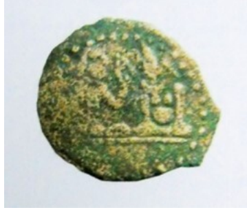
Görsel 2. Hakan ve Hatun Tasvirli Sikke, Göktürk Dönemi. (Babayar, 2007)

Cinsiyet eşitliği ilkesi, sanat eserlerine de aksetmiştir. Bu örneklerden bir grup, Göktürk dönemine ait sikkeler (Esin, 1991, s. 474; Babayar, 2007) olup Görsel 1’de verilen sikke, bunlardan biridir. Bu sikke üzerindeki bilgilerden anlaşıldığı üzere Yabgu II-Çırdanak’a aittir (“Yabgu II-Çırdanaktır”). Sikkenin kompozisyonunda ise karşıya bakar vaziyette iki figür betimlenmiştir. Soldaki figür kağanı temsil etmekte olup geniş ve yuvarlak yüzlü, saçları omuzlarına kadar uzanmaktadır. Sağdaki figür ise yüzü kağana nazaran biraz daha küçük başında sivri uçlu üç boynuzlu şapka bulunan hatuna aittir (Babayar, 2007, 66).