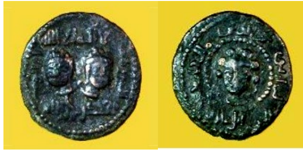
Görsel 21. Artuklu Halifesi Müstencid'e Ait Sikke, Bakır, Artuklu Dönemi, İstanbul Arkeoloji Müzesi. (Bulut, 2000)

İslam dininin mahremiyet anlayışı sebebiyle Türk Sanatında yabancı kadın ile erkeğin aynı ortamda betimlendiği kompozisyonlar azalmış, mevcut örneklerin çoğunluğu muhtemelen çift/eş imgesi veya İslami kaidelerin uygun gördüğü şartlar altında bir araya gelinmesi ile oluşturulmuştur. Bilhassa Osmanlı döneminde sıkı sıkıya bağlı kalınan İslami kaideler gerekçe gösterilerek çeşitli dönemlerde kadınların kıyafetlerine, sokağa çıkmalarına kısıtlamalar getirildiği bilinmektedir. Hatta Osmanlı minyatürlerinde yabancı kadın ve erkeklerin İslam dinine aykırı olarak aynı ortamda bulunduğu kompozisyonlar, kıyamet alametleri olarak değerlendirilmiştir (Dalkıran, 2012, s. 120).