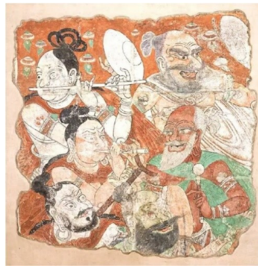
Görsel 13. Uyghur Müzisyenleri, Bezeklik duvar resmi, Uyghur Dönemi (8. Yüzyıl), Tokyo Özel Koleksiyonu. (Bozcu, 2009)

Türk kadını ve erkeğinin sosyal yaşamları hakkında çıkarım yapılmasını sağlayan kompozisyonlar oldukça önemlidir. Bu hususa vurgu yapan farklı dönem Türk Devletlerine ait yukarıdaki görseller, halkın entellektüel yönü ile ilgili bilgi vermektedir. Nitekim Görsel 12'ye ait kompozisyonda kadın musikişinaslar (Esin, 1972b, s. 241), Uyghur döneminde Bezeklik'te karşımıza çıkan duvar resminde ise enstrüman çalan figürler tasvir edilmiştir (Görsel 13) (Berklı, 2010, s. 158). Yukarıdaki kompozisyonlara benzer örnekler tarihi süreç içerisinde İslamiyet öncesi sürecin yanı sıra İslami dönemde de mevcut olup, bu görseller her iki cinsin sanatla iştiğal eden ve sanat icra edebilme yetkinliğine sahip kişiler olduklarını düşündürmektedir.