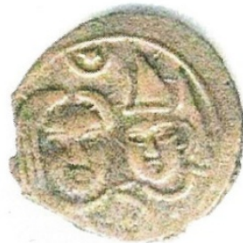
Görsel 1. Hakan ve Hatun Tasvirli Sikke, Göktürk Dönemi. (Babayar, 2007)

Dolayısıyla yazılı vesikalardan anlaşıldığı üzere bu toplumda erkeğin yanı sıra kadının da Tanrı tarafından kut aldığı, toplumun kurtarıcısı sıfatına sahip olduğu düşünülebilir. Zira tarihi süreç içerisinde mevcut bilgiler ve uygulamaların yanı sıra kadınların yönetici rolünü ön plana çıkaran unvanları da bu fikri destekler niteliktedir. Yine siyasi bakımdan tüm hususlarda kadın ile birlikte erkeğin karar meclislerinde, ulusal ve uluslararası görüşmelerde aktif rol üstlendikleri, söz ve yetki sahibi oldukları bilinmektedir. Zira kadınların alınan kararlar ve hükümler hususunda hem onay mercii hem de hüküm uygulayıcısı oldukları hatta verilen karar veya hükümlere aykırı durumlarda da yaptırım gücüne sahip oldukları tarihi vesikalardan anlaşılmaktadır. Ayrıca Türk kadınları tarihi süreç içerisinde genellikle erkek ile özdeşleştirilmiş çeşitli görevler de almışlardır. Hükümdar, kale muhafızı, vali ve sefirlik de yapmıştır (Tellioglu, 2016, s. 212). Dolayısıyla halkın cinsiyet sınırlandırılmasından uzak aktif konum/görevler üstlenebildikleri düşünülmektedir.