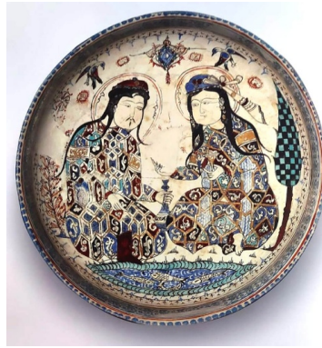
Görsel 24. Selçuklu Minai Tabak, XII- XIII. yüzyıl, İran, David Museum-Kopenhag. (Karpuz & Eravşar, 2013)

Selçuklu dönemine ait kumaşın yüzeyi boyunca sıralanan damla formlu madalyonların çevresinde kufi yazılı bir bordür bulunmaktadır. Madalyonun ortasında bir hayat ağacı, onun iki yanında kadın ve erkek figürü bulunmaktadır (Görsel 23) (Aslanapa, 2016, s. 358). Aynı döneme ait tabağın kompozisyonunun merkezinde karşılıklı olarak oturan figürlerinden erkek, elinde şişe tutmakta kadın ise elindeki kadehi doldurması için ona doğru uzatmaktadır (Görsel 24) (Karpuz & Eravşar, 2013, s. 220). Bu kompozisyon, erkeğin kadının içeceğini doldurması dolayısıyla hizmet etme vasfının cinsiyetle sınırlandırılmadığını göstermektedir.