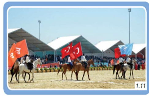
Tarihi bağlar, birlik ve beraberliğimizi artıran unsurlardır.