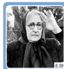
Halide Edip Adıvar ülkemizin yetiştirdiği önemli yazarlardan biridir.