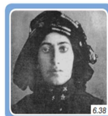
Kara Fatma (Fatma Seher Erden) Kurtuluş Savaşı'nın kadın kahramanlarından biridir.