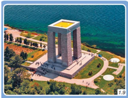
Çanakkale Şehitler Abidesi

Ders kitabında bulunan “Kültür ve Toplumsal Birliktelik” başlıklı konuda 1915 yılında Batılı sömürgeci güçlere karşı vatan uğruna canlarını veren Türk askerlerine saygı amaçlı yapılan Çanakkale Şehitler Abidesi görseli (Şekil 11) ve “Kültür ve Toplumsal Birliktelik” başlıklı konuda yer alan ve Türk milletinin asırlardan beridir farklı coğrafyalarda uygulayageldiği geleneksel oyun ve yarışların sergilendiği görselde (Şekil 12) geleneksel değerlere, kültüre ve bayrağa saygı amaçlanmakta ve vatanseverlik değeri vurgulanmaktadır.