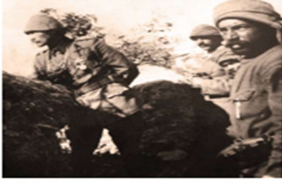
Görsel 2.19: Mustafa Kemal Çanakkale