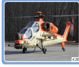
T129 ATAK Taarruz Taktik ve Keşif helikopteri