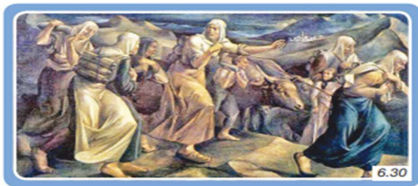
İstiklal Savaşında Cepheye Mermi Taşıyan Kadınlar Tablosu, Halil Dikmen, 1933, Resim ve Heykel Müzesi, Ankara