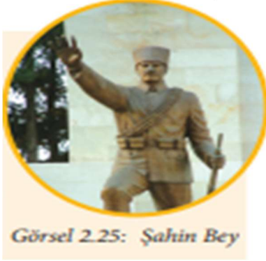
Görsel 2.25: Şahin Bey

Ders kitabında Güney Cephesinde Kahramanlar başlıklı metinde Milli Mücadele Dönemi’nin önemli şahsiyetlerinden olan ve Antep savunmasında Fransızlara karşı büyük mücadele veren Şahin Bey’in temsil edildiği görsel (Şekil 4) ile vatanseverlik değeri vurgulanmıştır. Milli Mücadele Döneminde İstanbul’dan Anadolu’ya silah taşımakta kullanılan İnebolu, Kastamonu, Çankırı, Ankara güzergâhlarını takip eden yol sonradan İstiklal Yolu olarak adlandırılmıştır. Ders kitabında Batı Cephesinde Savaş başlıklı konuda Milli Mücadele döneminin en zorlu günlerinin hangi yollarla aşıldığının görsel üzerindeki güzergâhlardan anlatılmaya çalışıldığı “İstiklal Yolu” görseli (Şekil 5) ile de vatanseverlik değeri vurgulanmıştır