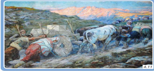
Kurtuluş Savaşı'nda Kağını Çeken Kadınlar Tablosu, İbrahim Çalli, 1920, Millî Mücadele'de Atatürk Konutu ve Demiryolları Müzesi, Ankara

“Sosyal Bilimlerin Toplum Hayatına Etkisi” başlıklı konuda yer alan Kurtuluş Savaşı’nda cepheye mühimmat taşıyarak çeşitli zorluklara göğüs geren Türk kadınların resmedildiği görselde (Şekil 13) ile aynı konu içeriğinde yer alan “Savunma Sistemleri” alt başlığı altında Türk vatanının iç ve dış saldırılara karşı korunması ve caydırıcı gücünün sergilenmesi adına Türk Savunma Sanayisi tarafından üretilen savunmaya dönük hava araçlarına (Şekil 14) yer verilmek suretiyle vatanseverlik değeri vurgulanmıştır.