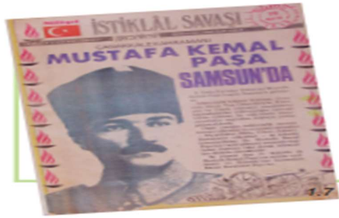
Şekil 7. “Mustafa Kemal Paşa Samsun’da” Başlıklı Gazete Görseli (S. 13)

Ders kitabında yer verilen Mustafa Kemal Paşa Samsun’da başlıklı gazete sayfasında (Şekil 10) bulunan “Millî Mücadele yıllarında Mustafa Kemal ve silah arkadaşları kadınıyla, erkeğiyle, genciyle, yaşlısıyla ülkemizin bağımsızlığı için mücadele ettiler. Özgürlük mücadelemizi, milli birlik ve beraberliğimizin önemini öğrenmenin, gelişimimize katkısı olduğunu” şeklindeki ifade ile vatanseverlik değerine vurguda bulunulmaktadır.