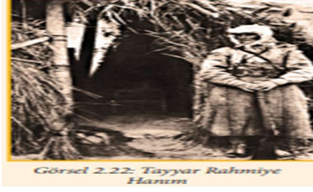
Görsel 2.22: Tayyar Rahmiye Hanım