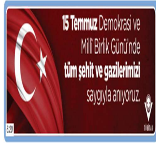
15 Temmuz Demokrasi ve Millî Birlik Günü'ne arma afişi

Ders kitabında “Toplumsal Hayatta Demokrasinin Önemi” başlıklı konuda 15 Temmuz hain darbe girişimini önlemek uğrunda şehit düşen Ömer Halisdemir’in fotoğrafı ile (Şekil 15) darbe girişimi sırasında gazi ya da şehit olan vatandaşların anısına hazırlanan afişe yer verilmek suretiyle vatanseverlik değeri vurgulanmıştır. “Toplumsal Hayatta Kadının Yeri” başlıklı konuda ise Kurtuluş Savaşı’nda cepheye mühimmat taşıyan kadınların temsil edildiği görsel (Şekil 16) ile farklı dönemlerde vatanları için farklı alanlarda hizmet eden Türk kadınlarını temsil eden görsellere (Şekil 17) yer verilmiştir. Farklı alanlarda ülkesine başarıyla hizmet etmiş Türk kadınlarına yer verilmek suretiyle vatanseverlik değerine dolaylı bir şekilde vurguda bulunulmuştur.