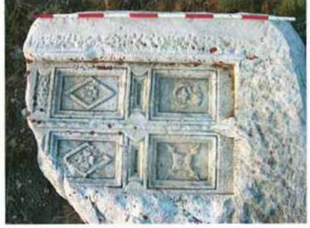
Res. 40. Eskişehir'in Sivrihisar ilçesi Kınık köyü, Hamamtepesi Mevkiindeki yerleşmede (env. no: İ26.A3.3) bulunan mermer mezar steli.