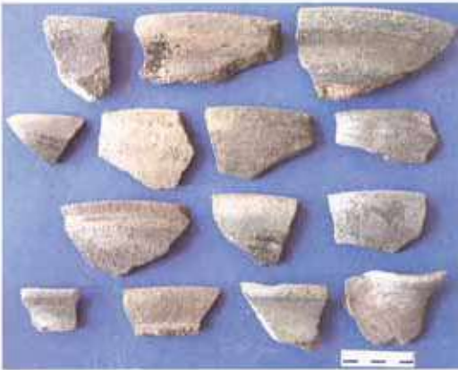
Res. 7. Yörükkaracaören köyü, Kalehöyük'ten (env. no: İ25.A3.21) Frig çanak çömlek parçaları.