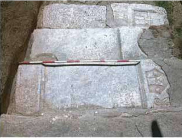
Res. 21. Eskişehir'in Beylikova ilçesi Emircik köyünde mermer steller.