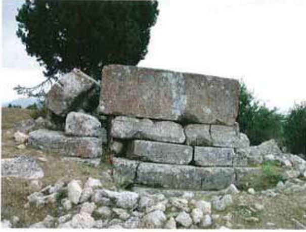
Res. 45. Eskişehir'in Mihalıccık ilçesi Çalçı köyü, Kadirören Mevkii, yapı kalıntısı (env. no: İ26.A3.51).