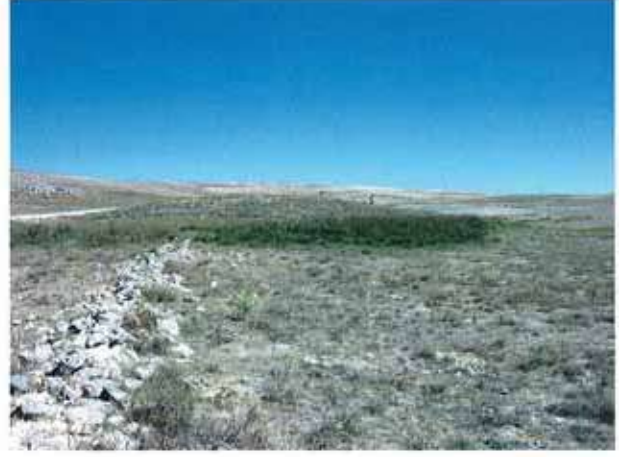
Res. 10. Eskişehir merkez ilçe Yörük Karacaören köyü, Gölüce III Höyüğü (env. no: İ25.A3.24).