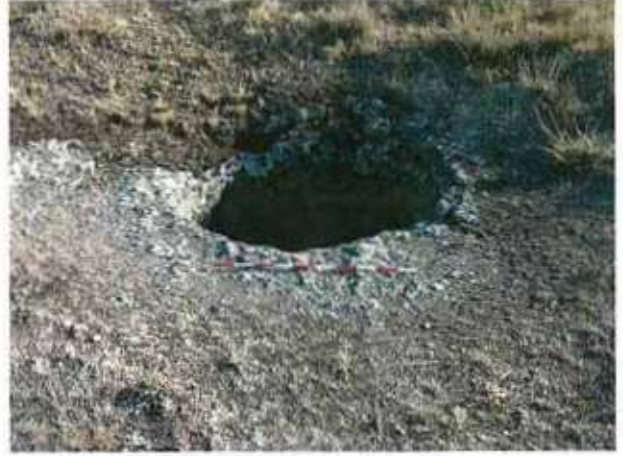
Res. 28. Eskişehir'in Beylikova ilçesi Doğray köyü, Deliktepe Mevkiindeki kaya sarnıçlarından biri (env. no: İ26.A3.73).