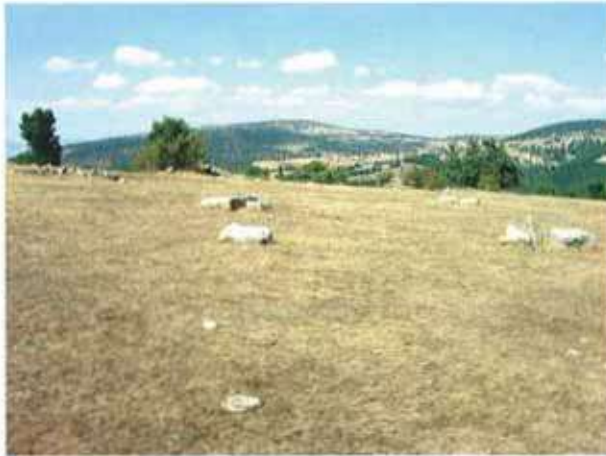
Res. 19. Eskişehir'in Alpu ilçesi Karacaören köyü Yapraklı Mevkii, Roma Devri nekropol alanı (env. no: I26.A3.62).