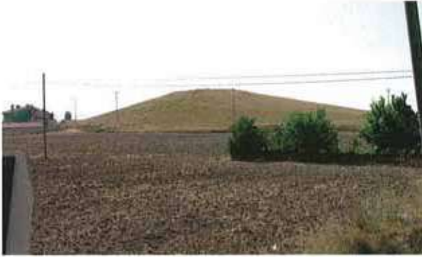
Res. 5. Eskişehir merkez ilçe Karacahöyük köyü, Karacahöyük (env. no: İ25.A3.14).