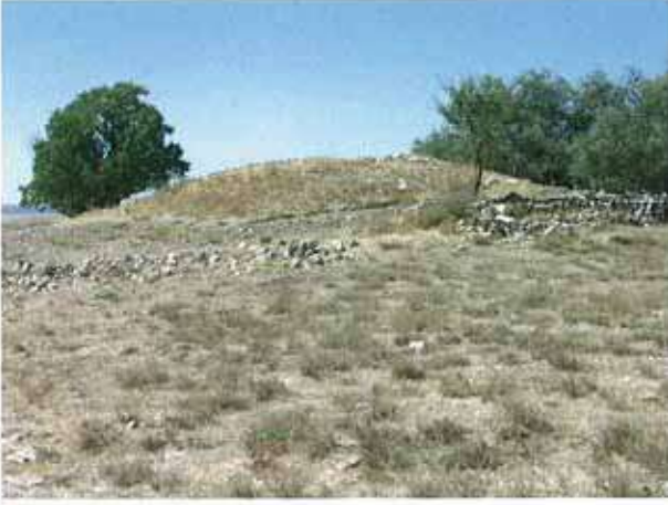
Res. 9. Eskişehir merkez ilçe Yörükkaracaören köyü, Gölüce II Höyüğü (env. no: İ25.A3.23).