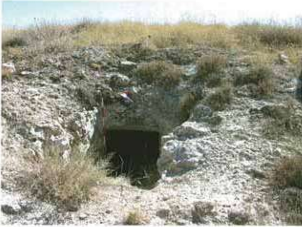
Res. 33. Eskişehir'in Sivrihisar ilçesi Dümrek Kızılburun Mevkii, Roma Devri nekropolünde (env. no: İ27.A3.25), kaya mezarı.