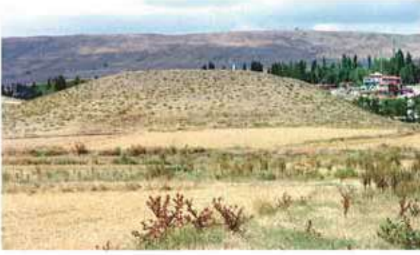
Res. 1. Eskişehir merkez ilçe Kozkaya köyü, Kumbag Höyük (env. no: İ25.A3.12).