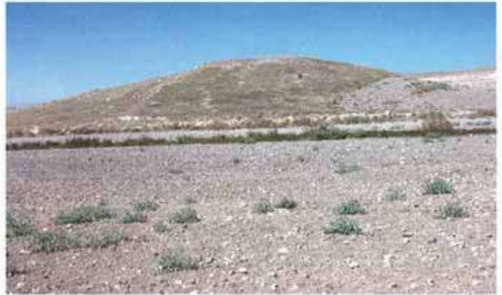
Res. 8. Eskişehir merkez ilçe Yörükkaracaören köyü, Gölüce I Höyüğü (env. no: İ25.A3.22).