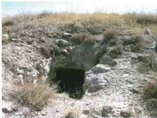
Res. 31. Eskişehir'in Beylikova ilçesi Halıbağı köyü, Çapıl Mevkii, Frig kaya mezarı (env. no: İ26.A3.64).