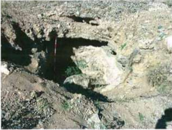
Res. 27. Eskişehir'in Beylikova ilçesi Doğray köyü, Karabayır Mevkiindeki kaya mezarlarından biri (env. no: İ26.A3.68).