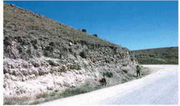
Res. 6. Eskişehir merkez ilçe Yörükkaracaören köyü, Kalehöyük (env. no: İ25.A3.21).