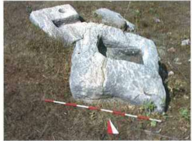
Res. 20. Eskişehir'in Alpu ilçesi Karacaören köyü Yapraklı Mevkii, Roma Devri mezarı.