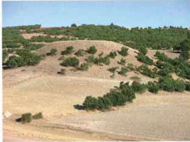
Res. 53. Eskişehir'in Seyitgazi ilçesi Göknebi köyü, Göknebi Höyük (env. no: J25.A3.36).