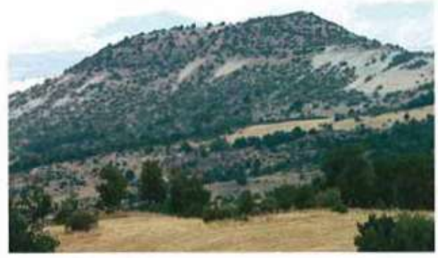
Res. 42. Eskişehir'in Mihaliçcik ilçesi Seki köyü, Aktepe Mevkii, Frig kalesi (env. no. İ27.A3.20).