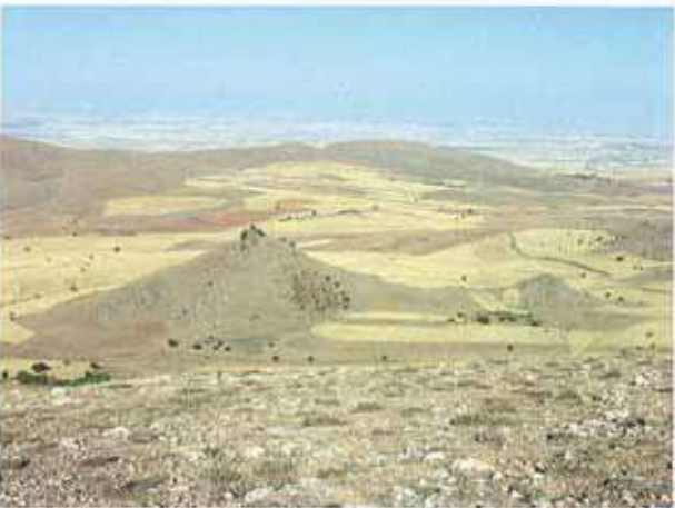
Res. 37. Eskişehir'in Sivrihisar ilçesi Karacakaya köyü, Hisartepesi (env. no: İ27.A3.28).