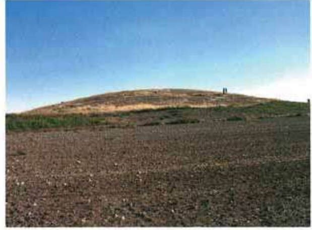
Res. 12. Eskişehir merkez ilçe Türkmentokat köyü, Sülhöyük (Suluhöyük) (env. no: İ25.A3.17).