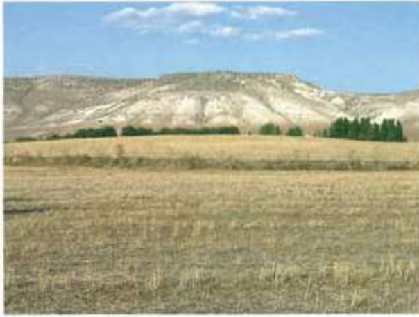
Res. 29. Eskişehir'in Beylikova ilçesi Doğray köyü, Pirenlik Mevkii, Pirenlik Höyük (env. no: İ26.A3.75).