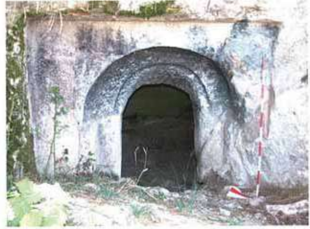
Res. 52. Eskişehir'in Seyitgazi ilçesi Üçsaray köyü, Osmanbey Mevkii, Roma Devri nekropolündeki (env. no: J25.A3.34) bir mezarın girişı.