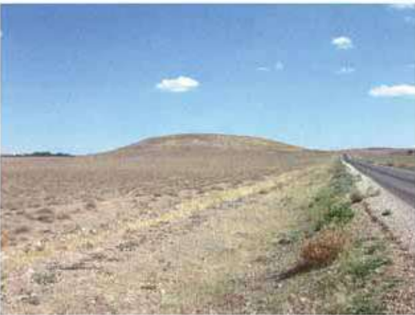
Res. 25. Eskişehir'in Beylikova ilçesi Doğray köyü, Doğray Höyüğü (env. no: İ26.A3.74).