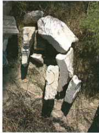
Res. 34. Eskişehir'in Sivrihisar ilçesi Dümrek Kızılburun Mevkii, Roma Devri nekropolünde (env. no: İ27.A3.25), yazıtlı ve bezemeli mimari parçalar.