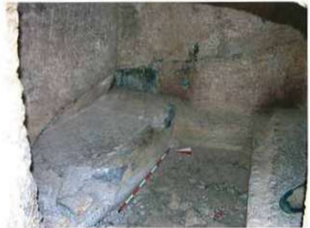
Res. 32. Eskişehir'in Beylikova ilçesi Halıbağı köyü, Çapıl Mevkiindeki Frig kaya mezarının (env. no: İ26.A3.64) mezar odasından ayrıntı.