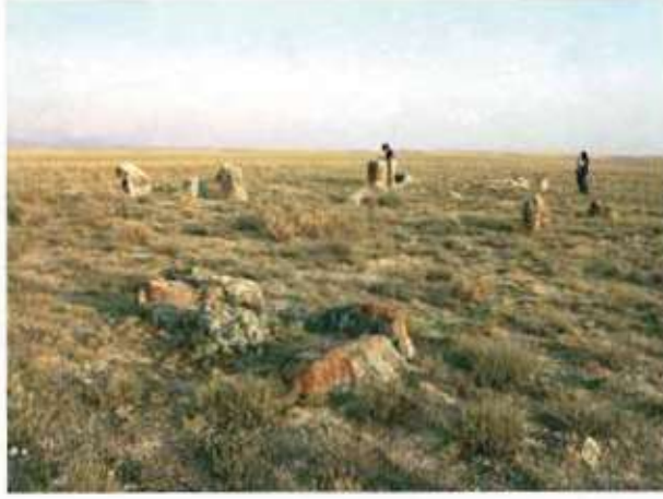
Res. 41. Eskişehir'in Sivrihisar ilçesi Yenice Mahallesi, Satrankız Mevkiindeki mezarlık (env. no. J26.A3.2).