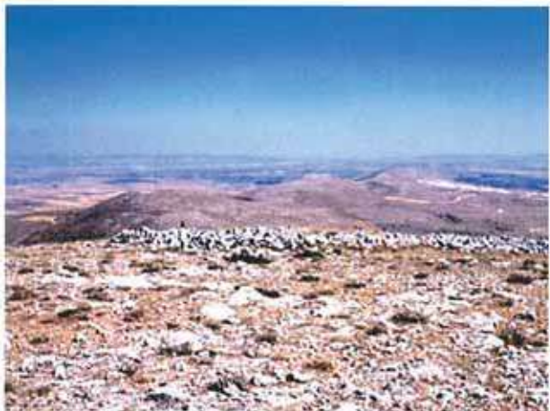
Res. 38. Eskişehir'in Sivrihisar ilçesi Dümrek, Çal Tepesi Mevkiinde Ortaçağ kalesi (env. no: İ27.A3.26).