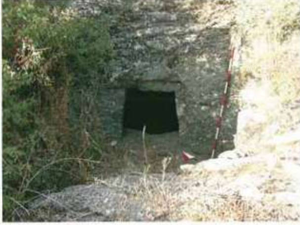
Res. 39. Eskişehir'in Sivrihisar ilçesi Karaburhan köyü, Habıbbınarı Mevkii, Frig kaya mezarı (env. no: İ26.A3.76).