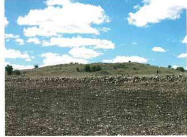
Res. 54. Eskişehir'in Seyitgazi ilçesi Cevizli köyü, Çakmak Mevkii Çakmak Höyük (env. no: J25.A3.39).