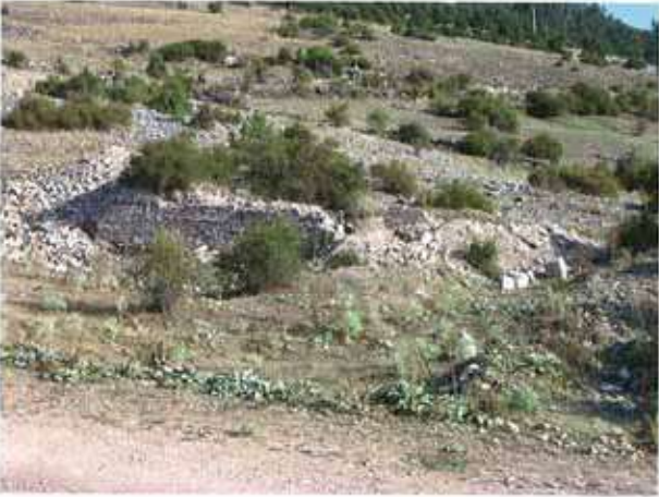
Res. 47. Eskişehir'in Mihalıccık ilçesi Otluk köyü, Kayapınarı Mevkii, kilise yapısı (env. no: H26.A3.2).