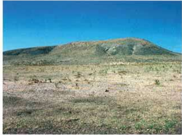
Res. 22. Eskişehir'in Beylikova ilçesi Emircik köyü, Yaslanbayır Höyüğü (env. no: İ26.A3.1).