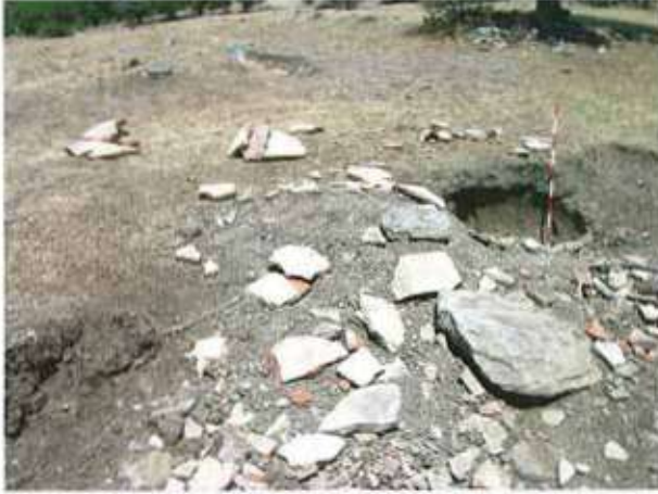
Res. 17. Eskişehir'in Alpu ilçesi Anıkaya köyü, Harman Yeri Mevkiinde kırık pithoslar.