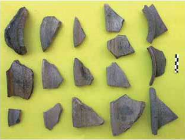
Res. 23. Eskişehir'in Beylikova ilçesi Emircik köyü, Yaslanbayır Höyüğü, Frig çanak çömlek parçaları.