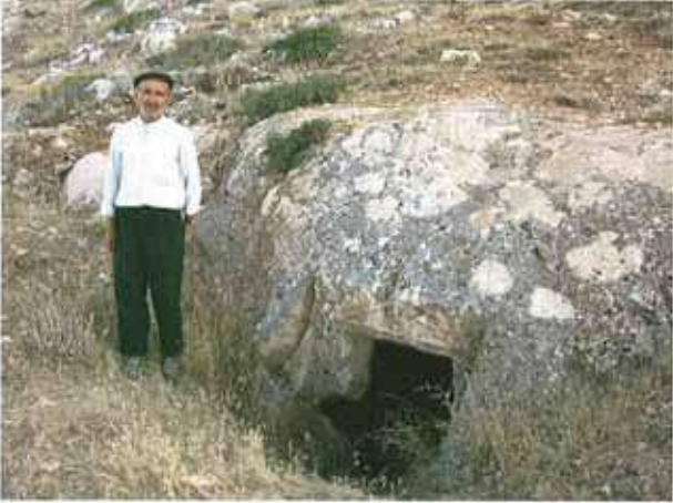
Res. 35. Eskişehir'in Sivrihisar ilçesi Karacakaya köyü, Çal Tepesi Mevkii Frig kaya mezarı (env. no: İ27.A3.27).