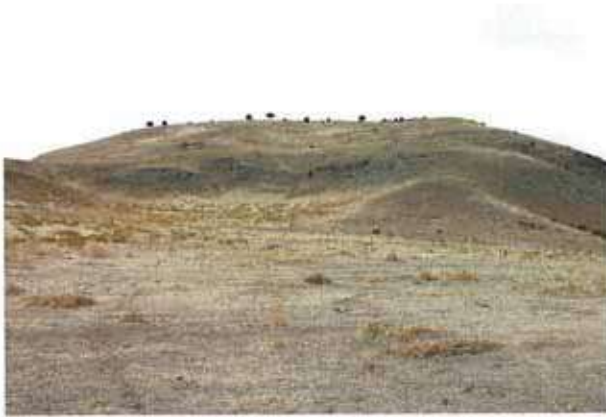
Res. 51. Eskişehir'in Mihaliçcik ilçesi Adahisar köyü, Adahisar kalesi (env. no: I26.A3.55).