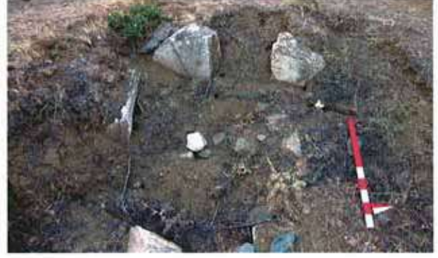
Res. 2. Eskişehir merkez ilçe Kozkaya köyü, kaçak kazılar sonucu ortaya çıkmış dromoslu mezar.