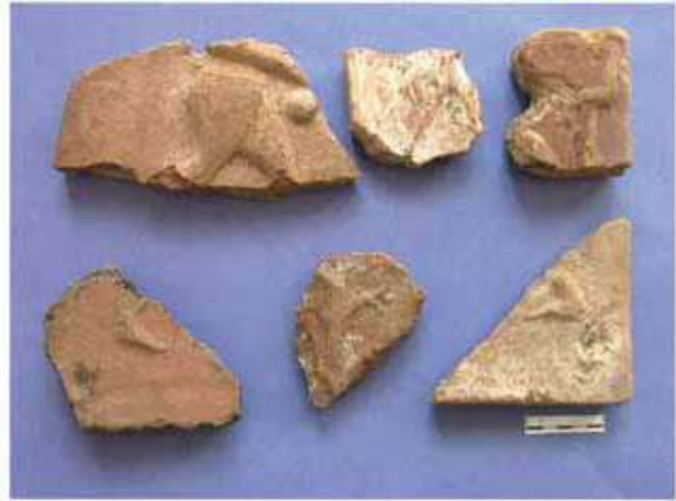
Res. 24. Eskişehir'in Beylikova ilçesi Emircik köyü, Yaslanbayır Höyüğü, Frig kaplama levhaları.