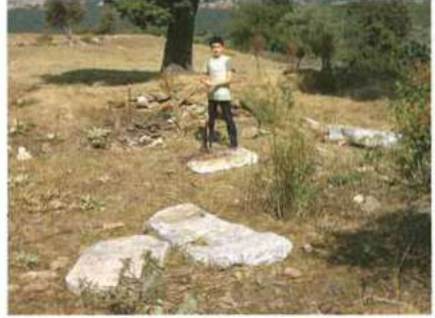
Res. 18. Eskişehir'in Alpu ilçesi Karacaören köyü Yapraklı Mevkii, Roma Devri nekropolünde (env. no: I26.A3.62), mermer mezar stelleri.