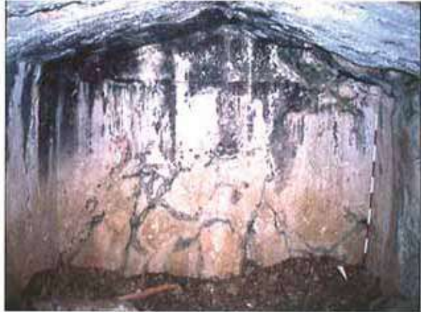
Res. 36. Eskişehir'in Sivrihisar ilçesi Karacakaya köyü, Çal Tepesi Mevkiindeki Frig kaya mezarının (env. no: İ27.A3.27) içten görünüşü.