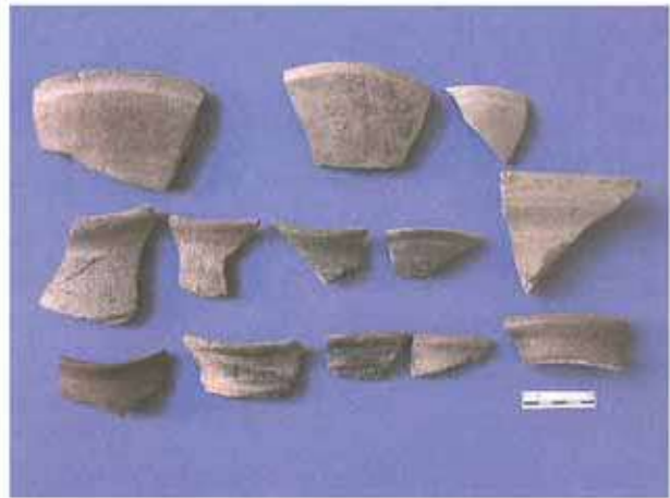
Res. 26. Eskişehir'in Beylikova ilçesi Doğray köyü, Doğray Höyüğü, Frig çanak çömlek parçaları.