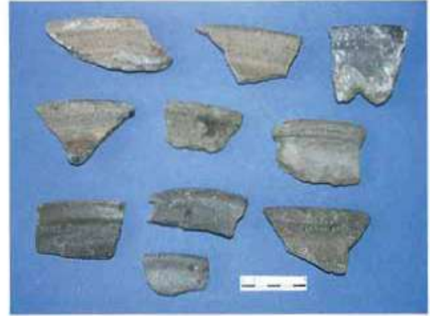
Res. 44. Eskişehir'in Mihaliçcik ilçesi Seki köyü, Aktepe Mevkiindeki Frig Kalesinden (env. no. İ27.A3.20) Frig gri çanak çömlek örnekleri.