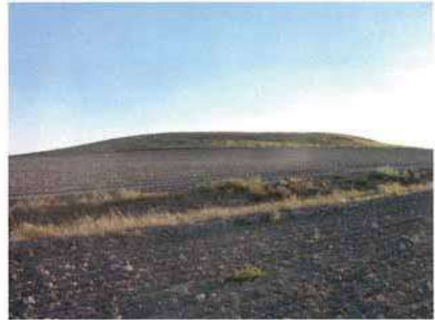
Res. 14. Eskişehir merkez ilçe Kalkanlı köyü, Toraman I Höyüğü (env. no: İ25.A3.19).