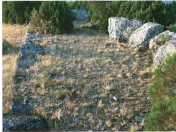
Res. 43. Eskişehir'in Mihaliçcik ilçesi Seki köyü, Aktepe Mevkiindeki Frig kalesinden (env. no. İ27.A3.20) sur ayrıntısı.