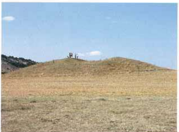
Res. 50. Kütahya'nın merkez ilçesi Uluköy, Uluköy Höyük (env. no: J24.A3.17).