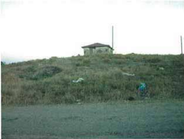
Res. 13. Eskişehir merkez ilçe Kalkanlı köyü, Kalkanlı Höyüğü (env. no: İ25.A3.18).