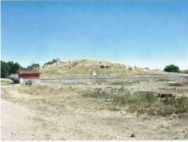
Res. 11. Eskişehir merkez ilçe İmişehir köyü, İmişehir Höyüğü (env. no: İ25.A3.25).