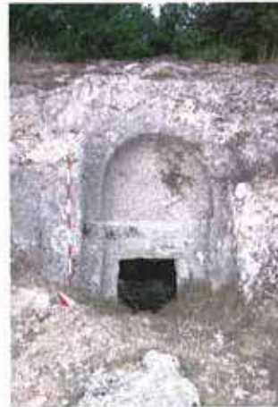
Res. 56. Bardakçı köyü Körestan İnleri Mevkiindeki mezarlıkta (env. no: J25.A3.28) bir kaya mezarı.