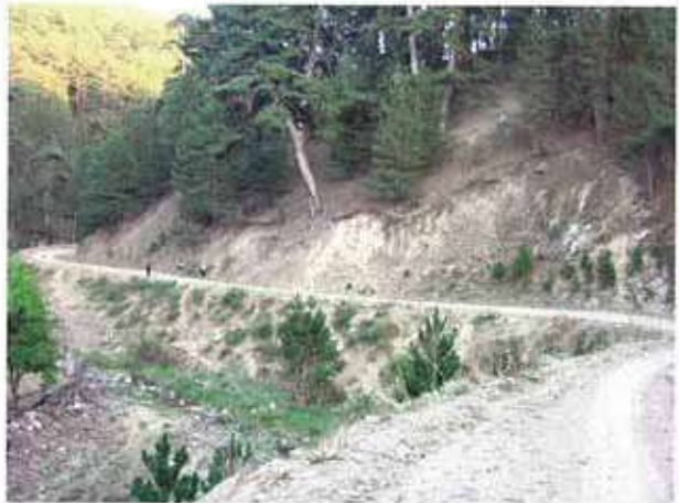
Res. 48. Eskişehir'in Mihalıccık ilçesi Otluk köyü, Değirmendere Mevkiindeki yamaç yerleşmesi (env. no: H26.A3.1).