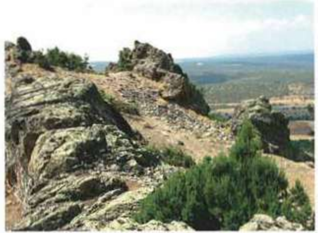
Res. 16. Eskişehir'in Alpu ilçesi Anıkaya köyü, Kale Yeri Mevkii, Ortaçağ kalesi (env. no: I26.A3.60).