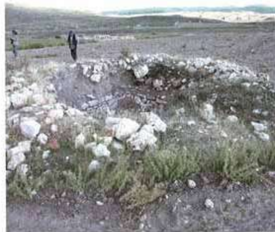
Res. 55. Eskişehir'in Seyitgazi ilçesi Bardakçı köyü Keçicayırı Mevkiinde tümülüslerin bulunduğu alan.