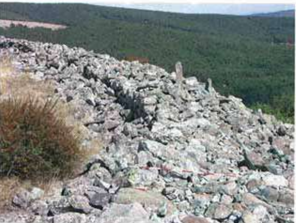
Res. 49. Eskişehir'in Mihalıccık ilçesi Dağcı köyünde Ortaçağ kalesi (env. no: İ26.A3.58).