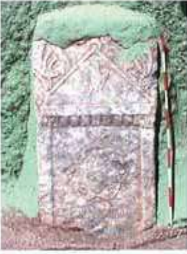
Res. 3. Eskişehir merkez ilçe Beyazaltın (Sepetçi) köyü, mermer adak steli.