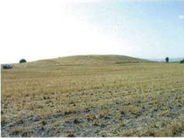
Res. 15. Eskişehir'in Alpu ilçesi Osmaniye köyü, Osmaniye Höyüğü (env. no: I25.A3.26).