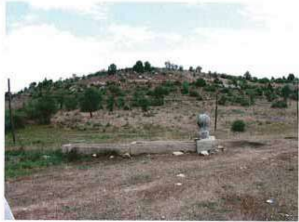
Res. 46. Eskişehir'in Mihalıccık ilçesi Çalçı köyü, Yeldeğirmeni Mevkii, Yeldeğirmeni Höyük (env. no: İ26.A3.52).