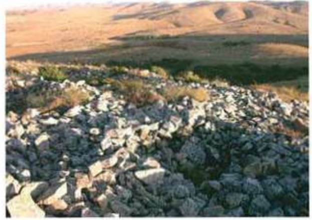
Res. 30. Eskişehir'in Beylikova ilçesi Halıbağı köyü, Hisarkale Mevkii, Ortaçağ kalesi (env. no: İ26.A3.63).