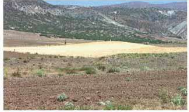
Res. 4. Eskişehir merkez ilçe Beyazaltın (Sepetçi) köyü, Çobanhöyük (env. no: İ25.A3.15).