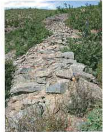
Res. 57. Mihaliçcik ilçesi Kızılıkbörüklü köyü, Asar Kale Mevkii Ortaçağ kalesi (env. no: I26.A3.56).