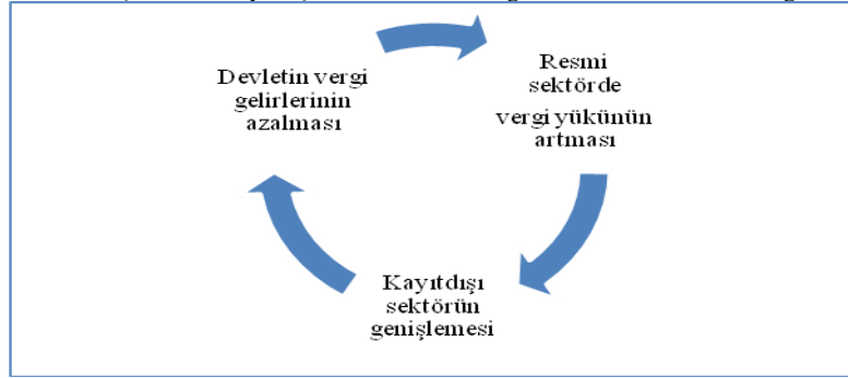
Şema 1: Kayıtdışı Ekonomi ve Vergilendirmede "Kısır Döngü"

Gerçekten de kayıtdışı sektörün en önemli olumsuz etkisi kamu gelirleri üzerindedir. Şema 1'de de ifade edildiği gibi kayıtdışı sektörün gelişimiyle devletin vergi gelirleri arasında bir "kısır döngü" ortaya çıkmaktadır. Şöyle ki, kayıtdışı sektörden ileri gelerek gelirleri azalan devlet, zorunlu olarak resmi sektörde vergi yükünü artırma yolunu seçmektedir ki, bu da resmi sektörde faaliyet gösterenlerin kayıtdışı sektöre yönelmesini daha da özendirir ve sonuçta daha büyük bir kayıtdışı sektör oluşturmaktadır.