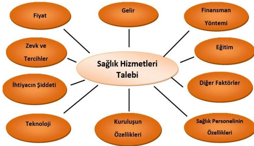
Şekil 1:Sağlık Hizmetleri Talebini Etkileyen Faktörler

ekonomide yeri olan bir olgudur, elde edilen bir değere karşılık olarak bir bedel ödenmesini ifade etmektedir. İhtiyaç ise talep ile bağlantılı fakat daha farklı değerlendirilmesi gereken bir kavramdır. Talep, ekonomik olarak bir bedel ödetirken, ihtiyaç, karşılığında ödenecek bir bedel olup olmadığına bakmadan, kişinin mal veya hizmet türünde hissettiği eksikliği ifade etmektedir [6]. Kısaca ifade etmek gerekirse, "ihtiyaç" talebe göre daha geniş bir kavram olma özeliği taşırken, "talep" için ise satın alabilme gücünü de kapsayan ihtiyaçlara yönelik bir kavramın kasta edildiğini ihtiyaçlar olduğunu söylemek mümkündür [7]. Hayatın devamını sağlayabilmek için sağlığın sürdürülmesi gereklidir, bu durum sağlık hizmetleri talebine etki eden önemli bir durumdur. Sağlık hizmetlerine talep, tıbbi bir ihtiyacın varlığına bağlı olarak ortaya çıkar ancak aslında bu talebin sağlığa olduğu, hizmetlerin çoğu zaman hiç alternatifinin olmadığı, çok az durumda alternatifinin olduğu gözden kaçırılmamalıdır [8]. Sağlık hizmetleri talebine diğer mal ve hizmetleri etkileyen unsurların yanı sıra mahiyetine özgü unsurlar da etki etmektedir.