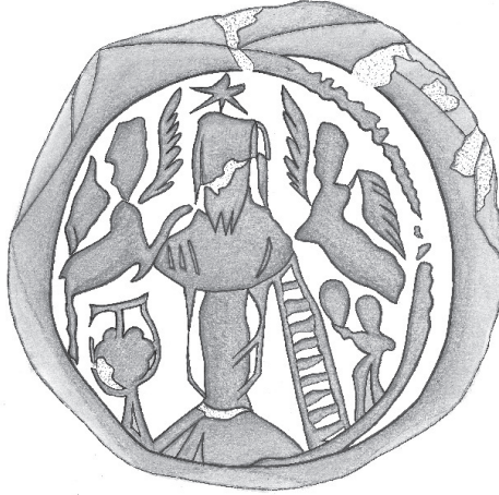
Ş. 2. Hacı Tokeni'nin ön yüz çizimi (Çizim: Z. Çakmakçı)

yaşadığı Mucizeler Dağı'ndan alınan kil ile yapıldıklarını ifade etmektedir 46 . Haluk Perk Müzesi'nde bulunan token de yazıta sahip olmamakla birlikte, bilinen örneklerle yakın benzerliği dolayısıyla Symeon tokenlerinden biri olarak görülmektedir.