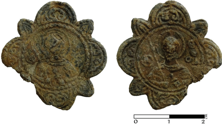
G. 14. Pandantif (enkolpion) (12.-14. yüzyıl) Ön ve arka yüz (Müze env no. HPM 15576) (Merve Toy, 2019)

Arka yüz: Bu yüzde madalyon içinde sağ elinde mızrak, sol elinde kınında kılıç taşıyan asker bir azize yer verilmiştir. Figürün sol tarafında net olarak okunan sütun sıralı ΘCOΔ(O) harflerinden oluşan Yunanca yazıttan Aziz Theodoros olduğu anlaşılmaktadır. Sağ omuz başında da aziz monogramına yer verilmiştir. Yonca biçimli enkolpionun dışa taşkın yarım yuvarlak formlu kısımları bitkisel bezeme ile doldurulmuştur.