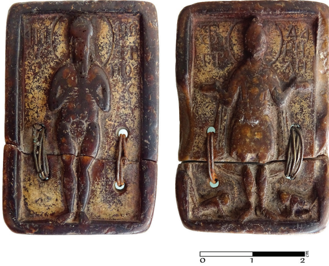
G. 3. Hematit Taşından Küçük İkona (12.-14. yüzyıl) Ön ve arka yüz (Müze env no. HPM 15573)

Hematit taşından 52 yapılmış küçük ikonanın bir yüzünde tasvir edilen Aziz Onouphrios ve yaşamı hakkında günümüze ulaşan bilgiler, münzevi olarak Mısır’da çölde ıssız bir yeri kendisine seçmiş olduğunu ve yaşamının sonuna kadar da buradan ayrılmadığını belirtmektedir. Kutsal günü 12 Haziran olan Aziz Onouphrios’un M.S. 400 civarında yaşamış olan bir münzevi olduğu bilinmektedir. Mısır’daki ünlü Teb şehri yakınlarında bulunan Hermopolis’deki bir manastırda keşiş olarak ruhani yolculuğuna çıktığı düşünülen Onouphrios, manastırdan ayrılıp ıssız çölde inzivaya çekilerek altmış yıl 53 kadar tek başına yaşamını sürdürmüştür ve burada ölmüştür 54 .