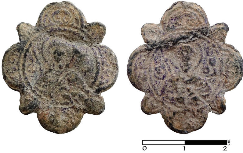
G. 16. Pandantif (enkolpion) (12.-14. yüzyıl) Ön ve arka yüz (Müze env no. HPM 15577) (Merve Toy, 2019)