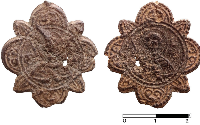
G. 15. Pandantif (enkolpion) (12.-14. yüzyıl) Ön ve arka yüz (Müze env no. HPM 15575) (Merve Toy, 2019)