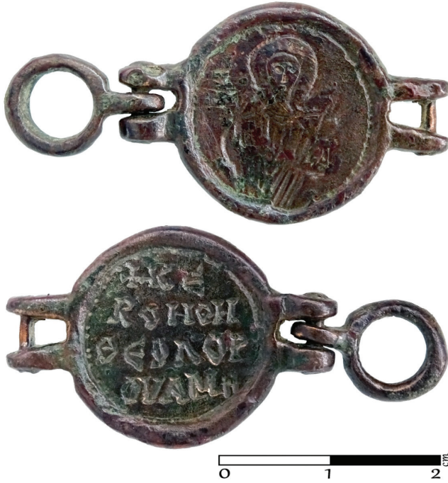
G. 11. Bronz obje (12.-14. yüzyıl) (Müze env no. HPM 15567) (Merve Toy, 2019)

Bu üç adet küçük boyutlu ve her iki yüzünde kutsal tasvir, motif ya da dua yazıtı içeren daire formu bronz objelerin iki yanlarında bağlayıcı halka aparatlar bulunmaktadır 81 . Bu objelerin tam formları kesin olarak bilinmemekle birlikte bilezik, kolye, kemer ya da pendentif parçaları olduğu düşünülmektedir.