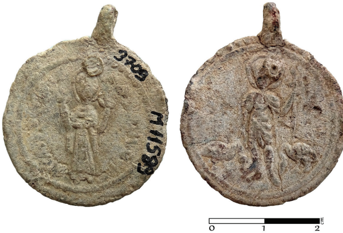
G. 8. Pandantif (enkolpion) (11.-13. yüzyıl) (Müze env no. HPM 15589)

Ön yüz: Pandantifin (enkolpion) ön yüzünde tam boy ve cepheden verilmiş Meryem Blakhernitissa tasviri bulunmaktadır 75 . Dıştan yuvarlak bir madalyon içine alınan figürün yüz detayı anlaşılammakta, bununla birlikte kostümü ve hareketleri ayrıntıyla tanımlanabilmektedir (G. 8). Meryem ayak bileklerine kadar uzun tuniği ve bedeninin üst bölümüne doladığı kollarından aşağıya uçları sarkan peleriniyle dua pozisyonunda tasvir edilmiştir.