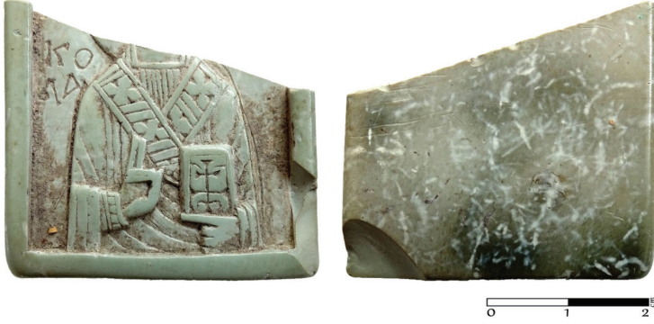
G. 5. Sabuntaşından (Steatite) İkona- Aziz Nikholaos (11-13. yüzyıl ?) Ön ve arka yüz (Müze env no. HPM 15572 (Merve Toy, 2019)

görülmektedir 65 . Bu anlamda sabuntaşından (steatite) küçük ikona, 11.- 13. yüzyıl arasında üretilmiş olmalıdır 66 .