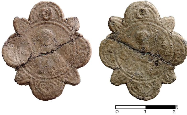
G. 17. Pandantif (enkolpion) (12.-14. yüzyıl) Ön ve arka yüz (Müze env no. HPM 15580) (Merve Toy, 2019)

Altı adet bronz pandantif (enkolpion) dört yapraklı yonca formu ile haç motifini vurgulamaktadır. 10. yüzyıldan itibaren benzer formda pandantifler (enkolpion) kullanılmaktadır 85 . Haluk Perk Müzesi koleksiyonunda yer alan dört yapraklı yonca formu içerisindeki haç şeklindeki pandantiflerin (enkolpion) 12.-14. yüzyıllar arasında tarihlendiği düşünülmektedir 86 .