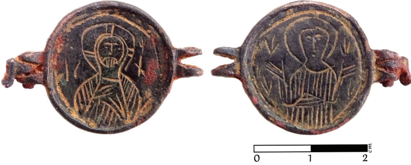
G. 10. Bronz obje (12.-14. yüzyıl) (Müze env no. HPM 15569) (Merve Toy, 2019)

Arka yüz: Bu yüzde yuvarlak madalyon içinde yarım boy ve cepheden Meryem tasvirine yer verilmiştir. Meryem orans pozisyonunda elleri iki yana açık ve son derece şematik olarak işlenmiştir 80 . Objenin her iki yanında bir başka madalyona ya da halkaya bağlanması için yapılmış menteşeler bulunur. Bunlardan birinin mil kısmı tahrip olmuşken, diğesinde bağladığı halkanın kırık bir ucu görülebilmektedir.