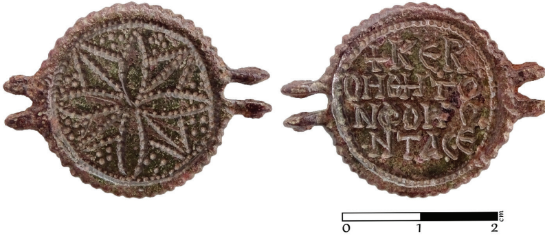
G. 9. Bronz obj e (12.-14. yüzyıl) (Müze env no. HPM 15568) (Merve Toy, 2019)

Ön yüz: Ön yüzde yuvarlak bir madalyonla çevrelenmiş, sekiz adet taç yapraktan oluşan rozet biçimli bitkisel bir motif yer alır (G. 9). Yapraklardan diyagonal yerleştirilenler üçgen; diğerleri oval biçimlidir. Yaprakların arasında kalan boşluklar nokta biçimli bezemelerle doldurulmuş, yaprakların dış konturları da birbirini takip eden nokta bezemelerle yapılmıştır. Bu motifi bitkisel motif ile stilize edilmiş bir haç olarak yorumlamak da mümkündür.