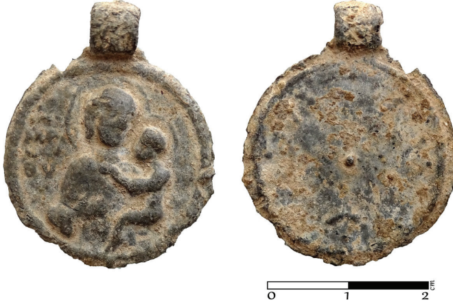
G. 6. Pandantif (enkolpion) (10.-11. yüzyıl ?) Ön ve arka yüz (Müze env no. HPM 15571)

Ön yüz: Oldukça aşınmış durumdaki madalyonun ön yüzünde Meryem Hodegetria tasviri bulunmaktadır (G. 6). Sol kolunda taşıdığı çocuk İsa'yı, sağ eli ile işaret eden Meryem, insanogluna kurtuluşa giden yolun İsa'nın öğretisinden geçtiğini vurgulamaktadır. Madalyonun sol tarafında sütun sıralı hâlde ve alt alta Meryem'in adının kısaltması olan MP ΘV (Tanrı Anası) siglasına yer verilmiştir. Pandantifin (enkolpion) üzerinde asılarak kullanılmasına yönelik bir kulp halkası bulunur. Yol Gösteren anlamına gelen Hodegetria unvanlı tasvirin gelişim süreci oldukça eskiye dayanmaktadır.