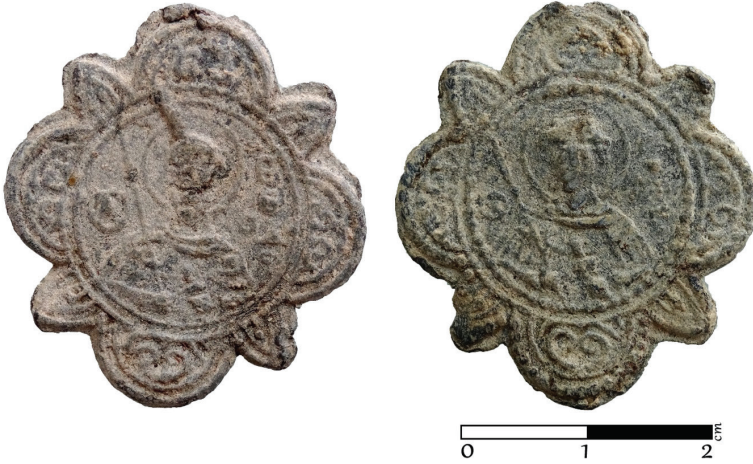
G. 13. Pandantif (enkolpion) (12.-14. yüzyıl) Ön ve arka yüz (Müze env no. HPM 15579) (Merve Toy, 2019)

Ön yüz: Bu yüzde kısa saç modeli ve kostümü dolayısıyla Aziz Georgios (?) olabileceğini düşündüğümüz bir asker aziz betimlenmiştir. Sağ elinde mızrak, sol elinde kınında kılıç taşıyan aziz yarım boy ve cepheden tasvir edilmiş ve yuvarlak bir madalyon içine alınmıştır. Solda aziz monogramı yer alırken, sağda silinerek netliğini kaybetmiş bir yazıt bulunur (G. 13). Yonca biçimli pandantifin (enkolpion) dışa taşkın yuvarlak bölümleri kıvrım dallardan oluşan bitkisel bir bezeme ile doldurulmuştur.