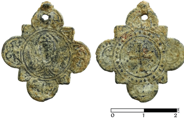
G. 12. Pandantif (enkolpion) (12.-14. yüzyıl) Ön ve arka yüz (Müze env no. HPM 15578)

Arka yüz: Nokta dizileriyle çevrili yuvarlak madalyonun ortasında uçları genişleterek açılan bir haç motifine yer verilmiştir. Haçın kolları eşit uzunluktadır. Pandantifin (enkolpion) yonca biçiminde dışa çıkıntı yapan yarım yuvarlak bölümleri içine ayrıntıları net olarak seçilmeyen bitkisel karakterli bir bezeme yapılmıştır. Objenin asılma halkası zamanla koptuğu ya da tahrip olduğu için en üste kalan yarım yuvarlak çıkıntı içine delik açılmış ve obje olasılıkla bu hâliyle kullanılmaya devam etmiştir.