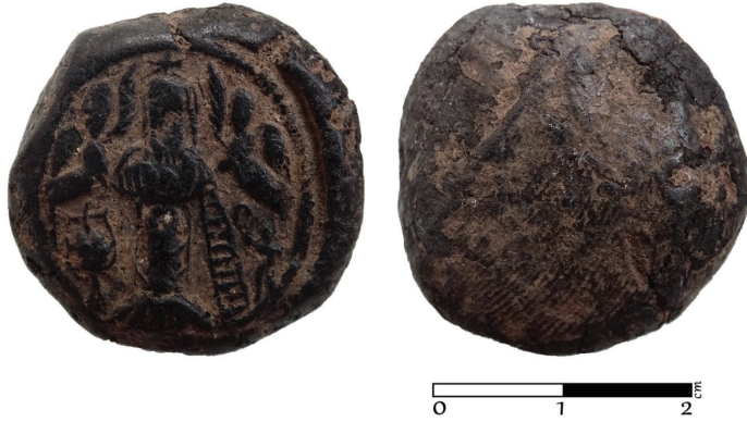
G. 1. Pişmiş Toprak Token (6.-7. yüzyıl) Ön ve arka yüz (Müze env no. HPM 15574) (Merve Toy, 2019)