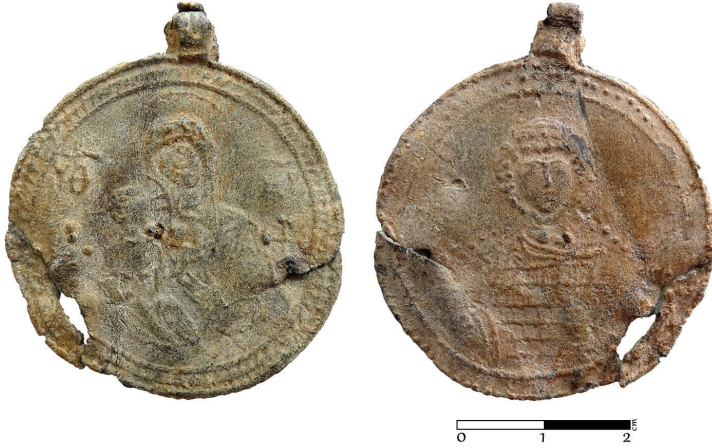
G. 7. Pandantif (enkolpion) (11.-12. yüzyıl) (Müze env no. HPM 15570) (Merve Toy, 2019)