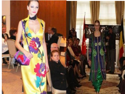
Resim 3. Ahmet Özceyhan “40. Yıl Seçkisi” 2013 (URL-27) Figure 3. Ahmet Özceyhan “40th Year Selection” 2013

Geleneksel Yaklaşımlar: Dünün ve bugünün sentezlendiği geçmişe yapılan bir atıf ve geleceğe bakan modern bir bakış olarak kabul edilmiş, Kapadokya’daki bir peribacasının duruşundan esinlenen elbisedir. Geleneksel yaklaşımlar, Orta Asya ve Anadolu topraklarındaki kültürü başka bir şekilde yaşatan tasarımlardan oluşmuştur. Bu haute couture tasarımlar bir kot üzerine veya kumaş bir pantolon üzerine günün her saatinde kolaylıkla kombinlenerek giyilebilmiştir (URL-26).