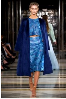
Resim 20. Barrus, “Sonbahar/Kış koleksiyonu 2016” (URL-29)