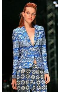
Resim 5. Atıl Kutoğlu, "İlkbahar/Yaz koleksiyonu 2011" (URL-18)

Moda tasarımcısı, yurt dışında kariyerine devam etmiş olup, etnik kimlikler üzerinden tasarımlarını zenginleştirdiği görülmüştür. Tasarımsal bakış açısının gelişmesinde içinde yaşadığı kültürün etkisi ile yalın çizgilerle tasarımlarını gerçekleştirildiği görülmektedir. Ayrıca Türk kültürüne ait izler taşıyan sembollerde kullandığı görülür. Anadolu'nun parçası olan bu semboller, tasarımcı tarafından renk, biçim ve dokularda baskın bir şekilde göze çarpmaktadır. Çalışmalarını Avusturya'da sürdüren tasarımcı, kültürel kodları modern bir anlayışla doğrudan tasarımlarında uygulamaktadır (Şari, 2017). Sanat gelenekleri ve bu geleneklerden doğan estetik kriterler, toplumların tarihindeki kültürel değerleri bir araya getiren motif, kompozisyon ve estetik kriterler toplumun inançları ile şekil almakta ve zamanla değişikliğe uğrayarak devam etmektedir (Karamağaralı, 1997).