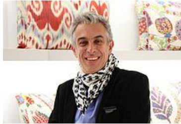
Resim 27. Rıfat Özbek, Moda Tasarımcısı (URL-13)

Figure 27. Rıfat Özbek, Fashion Designer