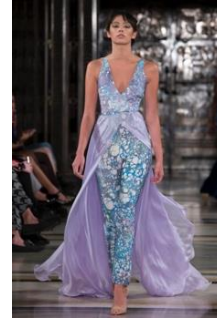
Resim 21. Barrus, “Sonbahar/Kış koleksiyonu 2016” (URL-30)