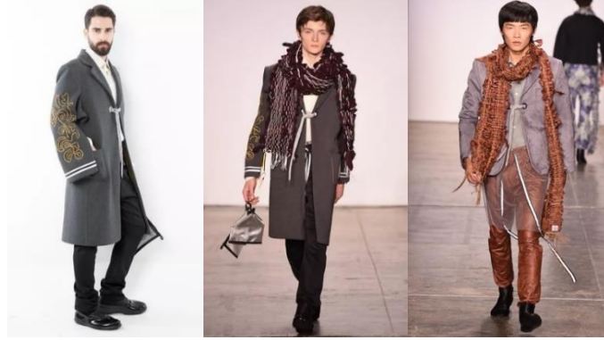
Resim 17a., 17b., 17c. “YEN” Anadolu Koleksiyonu (URL-7) Figure 17a., 17b., 17c. “YEN” Anatolian Collection

Resim 17b. ve 17c.’deki atkıların el dokuması ile tasarlandığı görülmektedir. Kumaşların fazlalıkları kullanılmış ve yeniden dokunarak atkı yapılmıştır. Dolayısıyla sürdürülebilirliğe bu tasarımlarında dikkat çektiği söylenebilir. Anadolu’da kullanılmış ürünlerin kumaşları atılmaz ve o kumaşlardan kilimler dokunurdu ve evlerde halı yerine kullanımları sağlanırdı. Bu tasarımda Anadolu’daki bu kültüre atıf yapıldığı görülmektedir. Çankırı yöresine ait erkek ceketlerinde düğme yerine bağcıklar görülmektedir. Bu bağcıklar ceketin önünün iliklenmesi ve kapaması için kullanılmaktadır. Bağcıkların Anadolu’daki ismi uçkur olarak bilinmektedir. Uçkur aynı zamanda pantolon ve şalvarların belinde kemer yerine kullanılan bağcığın da adıdır. Koleksiyon parçalarının hepsinde ceket kapamaları için uçkurların kullanıldığı görülmektedir. Bu bağcık tasarımcının tasarımlarında sıkça kullandığı ve kapama yöntemi olarak görülmektedir.