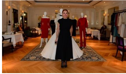
Resim 10. Dilek Hanif, “Kapsül Koleksiyon 2020” (URL-23) Figure 10. Dilek Hanif, “Capsule Collection 2020”

Dilek Hanif, Türk moda tarihinin öncülerinden olmuştur. Ünlü modacı 1962’de İstanbul’da doğmuştur. Modaya olan ilgisi daha çocuk yaşta ailesinin tekstil işletmesine yardım ederek başlamıştır. Dilek Hanif ilk moda markası Line’ı 1990 yılında kurmuştur. 2002 yılında gerçekleştirdiği ilk Haute Couture defilesini tarihi Aya İrini Kilisesi’nde yapmış ve böylece Uluslararası moda dünyasına adımını atmıştır. Geleneksel iğne oyası figürleri ile hazırlanmış olduğu koleksiyonu 2003 yılında tasarımcıya yılın en başarılı “Kadın Moda Tasarımcısı” Ödülü’nü aldırılmıştır. Toplumsal duyarlılık projeleriyle de dikkat çeken Dilek Hanif, projeleri destekleyerek yaşamda fark yaratılmasını, kültür varlıklarını ve tarihin korunmasını vurgulamıştır. Günümüzde Haute Couture tasarımları ve Couture kültürünün kendine has özelliklerini taşıyan koleksiyonlarına ait giysileri, dünyaca ünlü isimler ve stil ikonları tarafından tercih edilen Dilek Hanif markası, tüm dünyaya yayılma ve moda devleri arasında yer alma başarısı ile Türkiye’yi ve adını uluslararası alanda gururla temsil etmiştir (Url-22).