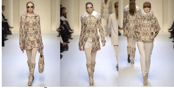
Resim 28a., 28b, 28c. Rifat Özbek, “Pollini Sonbahar Koleksiyonu, 2006” (URL-15) Figure 28a., 28b, 28c. Rifat Özbek, “Pollini Autumn Collection, 2006”

figüratif tasvirlerden kaçınmış olması hasebiyle daha çok bitkisel motiflerin kullanıldığı bilinmektedir. Osmanlı kumaşlarında yoğun ve çeşitli bir bitkisel motifler görülür (Alpat, 2010).