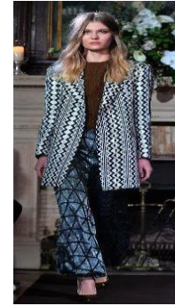
Resim 9. Atıl Kutoğlu "Sonbahar -Kış Koleksiyonu 2016" (URL-21)