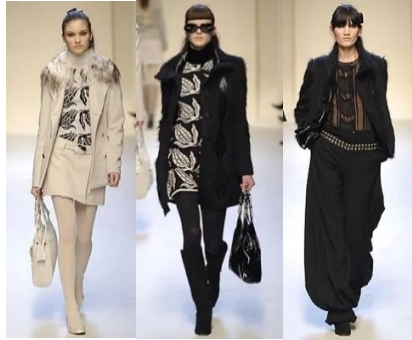
Resim 29. Resim 30. Resim 31.