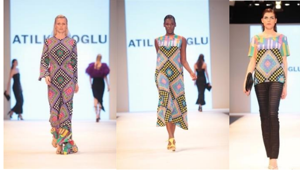
Resim 6a., 6b., 6c. Atıl Kutoğlu "İlkbahar /Yaz Koleksiyonu 2013" (URL-19)

görülen tasarımlarda kumaş dokumasında geometrik bezeme ile kompozisyonlar oluşturulduğu kullanılan renklerle hareket kazandırıldığı görülmektedir.