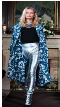
Resim 8. Atıl Kutoğlu "Sonbahar -Kış Koleksiyonu 2016" (URL-21)