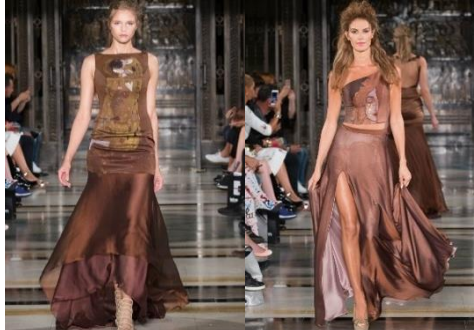
Resim 22a., 22b. Barrus, İlkbahar/Yaz Koleksiyonu 2017 (URL-31)

Barrus markasının evrensel moda alanında yer bulmasında en önemli pay yerel değer ve desenlerin modern anlayışla tasarlanması olmuştur. Ebru desenini deri yüzey üzerine aktarılması ile tasarlanan abiye elbiseler birbirleriyle uyumlu renklerle tasarlanmıştır.