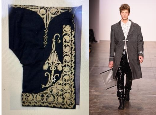
Resim 18a., 18b. “YEN” Anadolu Koleksiyonu (Kuş vd., 2023; URL-7) Figure 18a., 18b. “YEN” Anatolian Collection

Resim 17b. ve 17c.’deki atkıların el dokuması ile tasarlandığı görülmektedir. Kumaşların fazlalıkları kullanılmış ve yeniden dokunarak atkı yapılmıştır. Dolayısıyla sürdürülebilirliğe bu tasarımlarında dikkat çektiği söylenebilir. Anadolu’da kullanılmış ürünlerin kumaşları atılmaz ve o kumaşlardan kilimler dokunurdu ve evlerde halı yerine kullanımları sağlanırdı. Bu tasarımda Anadolu’daki bu kültüre atıf yapıldığı görülmektedir. Çankırı yöresine ait erkek ceketlerinde düğme yerine bağcıklar görülmektedir. Bu bağcıklar ceketin önünün iliklenmesi ve kapaması için kullanılmaktadır. Bağcıkların Anadolu’daki ismi uçkur olarak bilinmektedir. Uçkur aynı zamanda pantolon ve şalvarların belinde kemer yerine kullanılan bağcığın da adıdır. Koleksiyon parçalarının hepsinde ceket kapamaları için uçkurların kullanıldığı görülmektedir. Bu bağcık tasarımcının tasarımlarında sıkça kullandığı ve kapama yöntemi olarak görülmektedir.