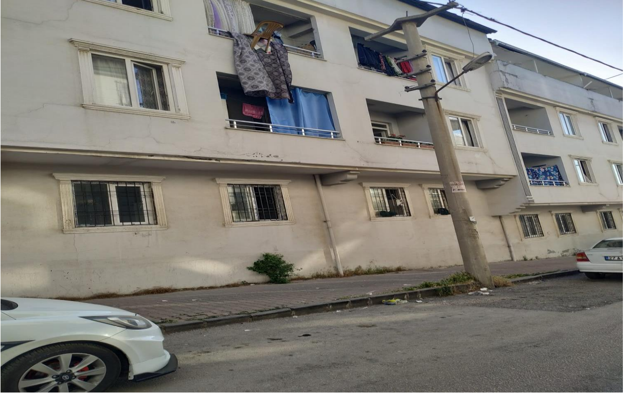
Fotoğraf 2: Suriyelilerin kaldığı bina (Orijinal, 02.06.2022).