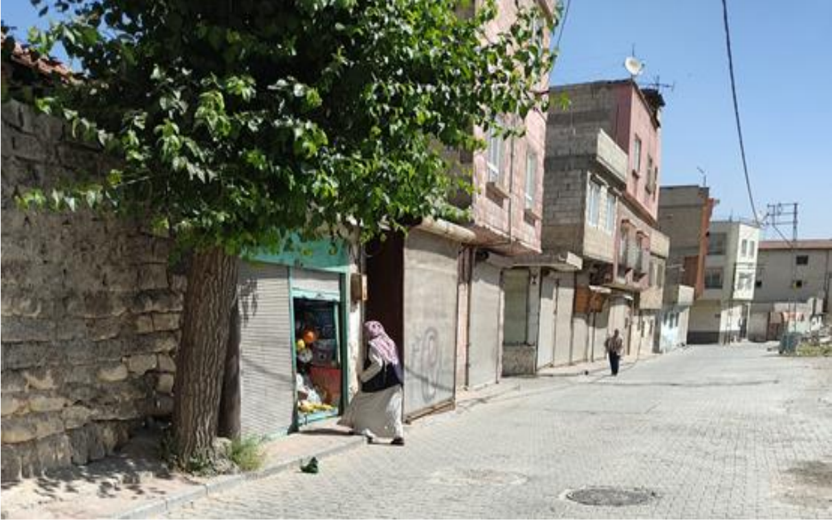
Fotoğraf 3: Suriyelilerin ikamet ettiği mahalle (Orijinal, 02.06.2022).