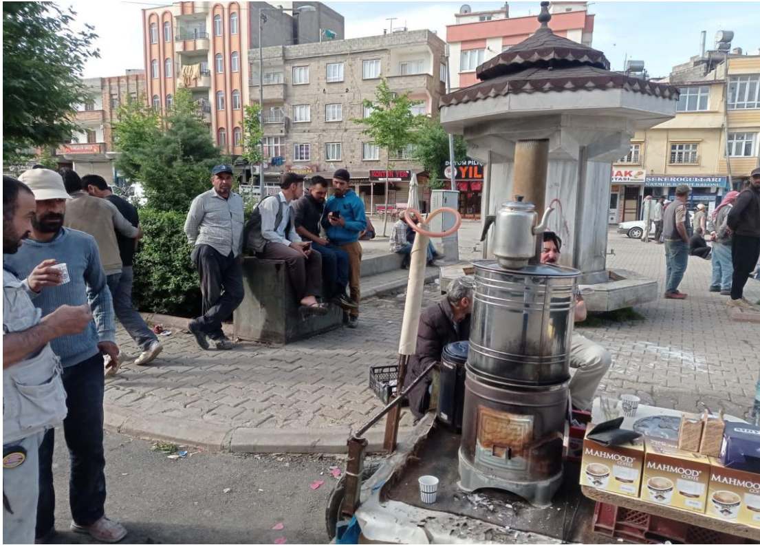
Fotoğraf 6: Gaziantep'te meydana çay ve kahve satışı yapılan seyyar satıcı ve Suriyeliler (Orijinal, 22.05.2022).