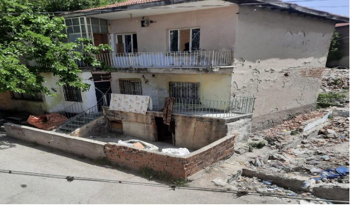
Fotoğraf 1: Suriyelilerin ikamet ettiği mesken (Orijinal, 29.05.2022).