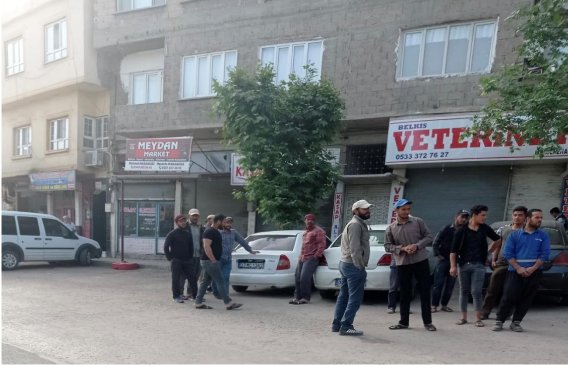
Fotoğraf 5: Gaziantep'teki bir mahallede Suriyeliler (Orijinal, 22.05.2022).