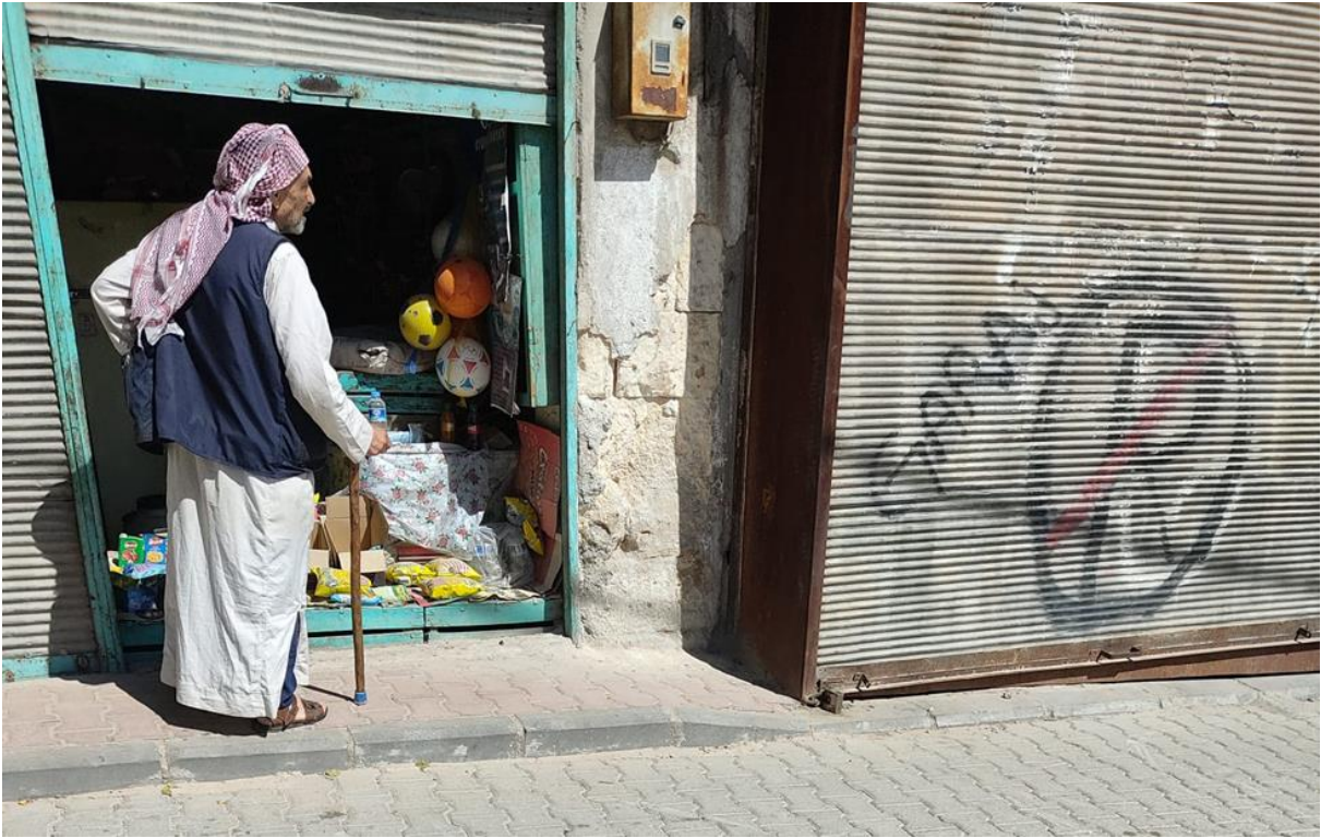
Fotoğraf 4: Bir bakkalın önünde Suriyeli (Orijinal, 02.06.2022).