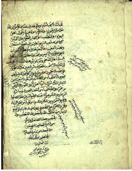
Ek 2: Kasıdecizâde 672 nüshası ilk ve son sayfalar