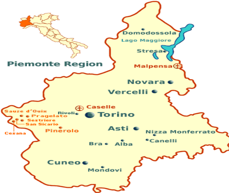
Şekil 2. Piyemento Bölgesi ve Bra Kent Haritası("Trip Savvy", 2021).

İtalya Cumhuriyeti'nin beşi özel statülü, onbeşi olağan statülü olmak üzere toplamda yirmi bölgesi bulunmaktadır. 1960'lı yıllardan sonra bölge yönetimlerine idari ve mali olarak daha çok yetki veren merkezi hükümet yerleşmeye yönelik çalışmalar yapmaya devam etmiştir.