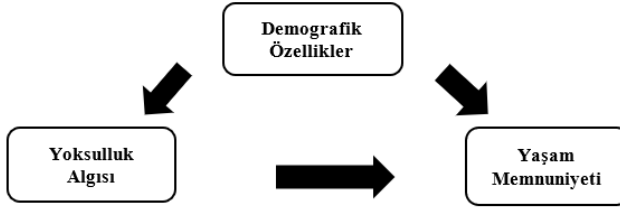
Şekil 1: Araştırma Modeli

İstatistiksel tarama modelleri üzerinde yapılan çalışmada, araştırma hedeflerine ve sorularına bağlı olarak araştırma modeli Şekil 1'teki gibi görselleştirilebilmektedir.