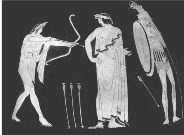
Resim 10. Niobidler Ressamı'na atfedilen ve M.Ö. 460'a tarihlenen pelikedeki Apollon Paris'in oklarını Akhilleus'un topuğuna yönlendiriyor.

Hellen mitolojisindeki tek saygın okçuluk yarışının Akhilleus'un cenaze oyunlarında düzenlendiği söylenebilir: "...Derler ki Akhilleus (ölümünden sonra) kutsal adalarda Medeia'ya eşlik ederken onuruna oyunlar düzenlediler, Eumelos at (arabası) yarışını, Diomedes ayak yarışını (koşu), Aias halka yarışını, Teukros okçuluğu kazandılar..." (Apollodoros 5.11). Yarışın ayrıntılarını ise Quintinus Smyrnaeus verir. "...Sonra Oileus'un oğlu (Aias) ve Teukros öne çıktılar ve bunlardan uzakta mızrakların efendisi Agamemnon tüy sorguçu bir miğfer koydu ve dedi ki tüyleri temizleyen en iyi atıştır. Böylece okunu ilk olarak Aias fırlattı ve miğferin kenarını sertçe sıyırdı. İkinci olarak Teukros fırlattı ve en hakeden atışı yaptı, tüyleri kenardan ayırdı. Onlar bakarken insanlar tezahürat etti ve onu bolca övdüler ve hala ayağı acı içinde olmasına rağmen ellerini kesinlikle titretmediği için..." (Smyrnaeus 4.199).