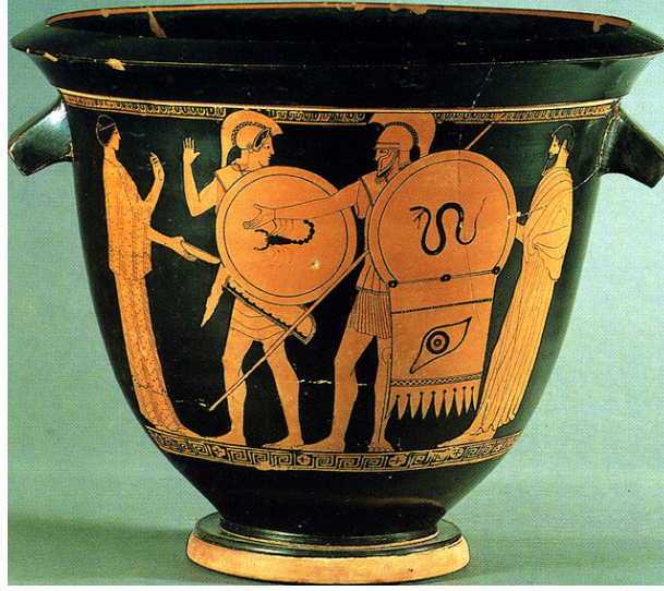
Resim 5. Altamura Ressamı'na atfedilen ve M.Ö. 470-460 yıllarına tarihlenen kırmızı figürlü çan krater. Aias ve Teukros'un evden ayrılışı? Soldaki genç figürün kalkanında bir akrep figürü var ve sadak taşıyor.

belladonna nın da mızrak uçlarının batırıldığı zehrin elde edilmesinde kullanıldığını ve bu yüzden bu bitkinin de doryknion olarak anıldığını aktarır. Buradan anlaşılacağı üzere savaş aletleri ve zehirler birbiriyle oldukça ilişkilidir ki zaman zaman aynı kelimelerle anılırlar. Bunlar dışında antik kaynaklardan isimlerine ulaşılabilen savaş ve av aletlerinin zehirlenmesinde kullanılan birçok bitki ve hayvan bulunmaktadır.