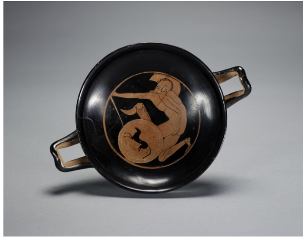
Resim 6. Pithos Ressamı'na atfedilen ve M.Ö. 490'a tarihlenen kırmızı figürlü kyliksin tondosunda bir Hellen okçusu at betimli kalkanıyla görülüyor.

Hellen mitolojisine bakılacak olduğunda, okların ve yayların genelde kötü talih getirdiği görülür, Apollon'un okları genelde felaketlere yol açar. Örneğin İlyada, Apollon'un Akhalara gönderdiği veba oklarıyla başlar 3 . Antik kaynaklara göre Apollon tarafından biri Eurytos'a , diğeri ise