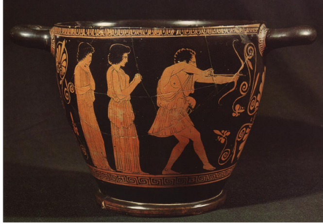
Resim 11. Penelope'nin taliplerini ok yağmuruna tutan Odysseus. M.Ö. 440 civarı.

Apollon'un hediye ettiği ok ve yaylara geri dönülecek olursa, bunların şans getirdiği yegâne ismin İskit kökenli Abaris Hyperboreios olduğu görülür. Apollon rahibi olan Abaris ondan aldığı altın okla dünyayı dolaşır ve mucizeler yaratır, salgınlara son verir (Herodotos 4:36). Apollon'un oklarının hiçbir Hellene değil de Troialılara ve bir İskite şans getirmesi ilginçtir.