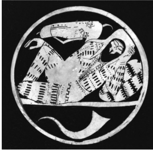
Resim 2. Kırmızı figürlü vazo resminde sarhoş İskit görünümü okçu.