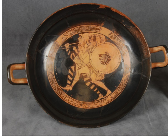
Resim 4: Ressam Douris’e atfedilen kırmızı figürlü kylixin tondosunda Hellen ve İskit okçular yan yana ilerliyor.