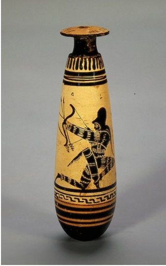
Resim 3. M.Ö. 470’ e tarihlenen siyah figürlü alabastronda İskit okçusu tipik kıyafeti ve gorytosu ile ok atışı yapıyor.