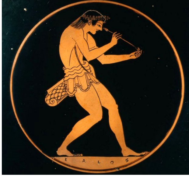
Resim 1. Geç Arkaik Dönem'e ait kırmızı figürlü kylix. Sadak takmış olan Hellen okçusu okunu inceliyor. Kalos yazıtının bulunması ve figürün Hellen görünümlü olması okçuluğu bu vazo resminde prestijli bir aktivite olarak yansıtıyor.

Hellenlerin okçuluğa bakışı oldukça karmaşıktır. Hemen her spor dalında müsabakalar düzenlenmesine rağmen Olympiatlar ya da Panathenaia gibi saygın etkinliklerde düzenlenmiş bir okçuluk müsabakasının kaydı yoktur. Apollon ve Artemis gibi önemli tanrılara ve Hellen Mitolojisinin en ünlü yarı-tanrı kahramanı Herakles'e okçulukla ilgili üstün yetenekler atfedilmiştir. Ancak okçuluğu hor gören yaklaşımlar da mevcuttur. Euripides'e ait "Herakles'in Deliliği" adlı oyunda Thebai tahtını işgal eden Lykos, Herakles'in karısı Megara'ya "Canavarlarla olan mücadeleleriyle ün kazanmış, eğer bunlar zayıflık sayılacaksa asla kalkanını kaldırmayan ve mızrakla yüzleşmeyen bir adam, fakat bir yayla, bir korkağın silahıyla her an kaçmaya hazır. Okçuluk asla erkeksi cesareti ölçecek bir test değildir, hayır!" diye seslenir.