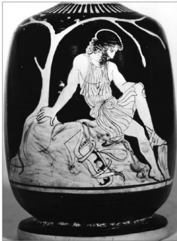
Resim 9. Philoktetes terkedildiği adada, M.Ö. 420 civarı kırmızı figürlü Atina vazosu.

İlyada boyunca zehirli oklarla ilgili birçok olaya şahit olunur, anlaşılabilir ki oklar ile zırh ve miğferleri delmekten ziyade tende bir açıklık bulup zehirlerini zerk etme amaçlanmıştır, ayrıca savaş yaraları çoğunlukla irinli ve kokuludur. Savaşta Akhaların en öne çıkan okçusu olan Teukros'un okları çoğunlukla Apollon tarafından engellenir, yayı Zeus tarafından kırılır.