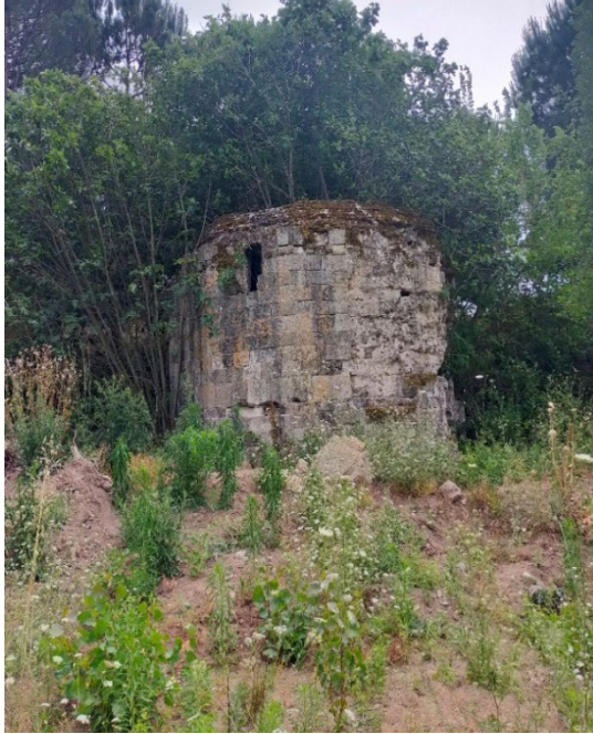
Resim 1: Türbenin genel görünümü.

Yapı on bir kenarlı gövde, tuğladan ve ortası açık bir örtü sistemi, batısında bir mazgal pencere, ( Res. 1 ) kuzey yönde bir giriş açıklığı, bu açıklığın batı yanında bulunan ve ne olduğu belli olmayan bir dış çıkıntıya sahiptir. ( Şek. 1 ) İçerisindeki çöp, moloz ve bitkiler sebebiyle bir sanduka, mezar taşı veya mezar mevcut olup olmadığı bilinmemektedir.