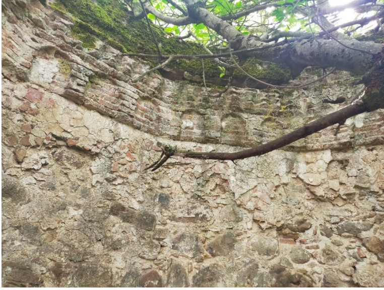
Resim 9: Türbenin içinden görünümü.