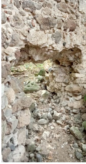
Resim 7: Yığılma taşla kapatıldığı düşünülen açıklığın içerden görünümü.

İçerde yer yer kalın bir sıva tabakasıyla kaplı türbenin, iç kenarlarının daha az belirgin olduğu, neredeyse daireye yakın bir şekil aldığı gözlemlenebilmektedir. (Res. 8) Gövdenin üzerinde, mazgal pencerenin olduğu kenar hariç, her kenarda tuğladan, yuvarlak kemerli üçer sağır niş bulunmaktadır. Yuvarlak kemerli nişleri, üstte tuğla malzemeyle yapılmış mukarnas benzeri testere dişleri takip etmektedir. (Res. 9) Bunların da üzerinde tuğla malzemeyle yapılmış örgü sistemi görülmektedir. Tuğla örgü saçak seviyesinin üstünde kırılmalar yaparak yukarı doğru hafifçe daralmaktadır. Bu durum yapının bir külahla örtülü olduğunu düşündürmektedir ancak külahla örtülü olması halinde örtüde daha dik bir açığı görülmesi gerekirken burada tuğla örgünün basık inşa edildiğini görülmektedir. Dolayısıyla türbe gövdesinin ne bir külahla ne de bir kubbeyle örtülü olmadığı anlaşılmaktadır.