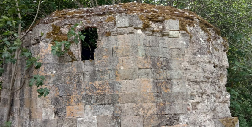
Resim 3: Türbenin doğudan görünümü.