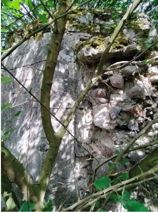
Resim 6: Yiđma taşla kapatıldıđı düşünölen açıklıđın dışardan görünümü.