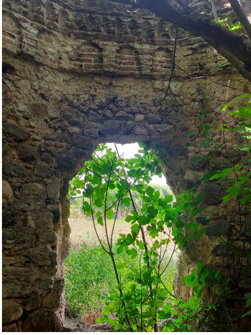
Resim 5: Türbenin giriři.