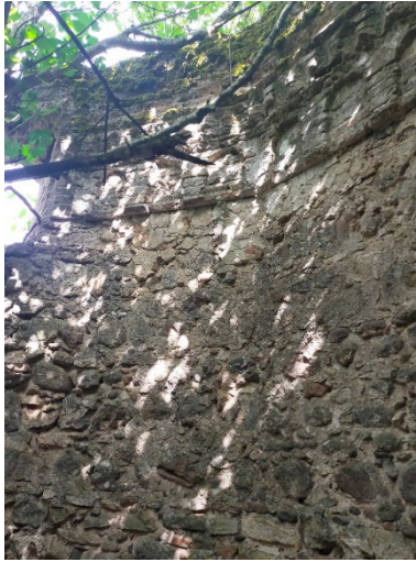
Resim 8: Türbenin içerden görünümü.

İçerde yer yer kalın bir sıva tabakasıyla kaplı türbenin, iç kenarlarının daha az belirgin olduğu, neredeyse daireye yakın bir şekil aldığı gözlemlenebilmektedir. (Res. 8) Gövdenin üzerinde, mazgal pencerenin olduğu kenar hariç, her kenarda tuğladan, yuvarlak kemerli üçer sağır niş bulunmaktadır. Yuvarlak kemerli nişleri, üstte tuğla malzemeyle yapılmış mukarnas benzeri testere dişleri takip etmektedir. (Res. 9) Bunların da üzerinde tuğla malzemeyle yapılmış örgü sistemi görülmektedir. Tuğla örgü saçak seviyesinin üstünde kırılmalar yaparak yukarı doğru hafifçe daralmaktadır. Bu durum yapının bir külahla örtülü olduğunu düşündürmektedir ancak külahla örtülü olması halinde örtüde daha dik bir açığı görülmesi gerekirken burada tuğla örgünün basık inşa edildiğini görülmektedir. Dolayısıyla türbe gövdesinin ne bir külahla ne de bir kubbeyle örtülü olmadığı anlaşılmaktadır.