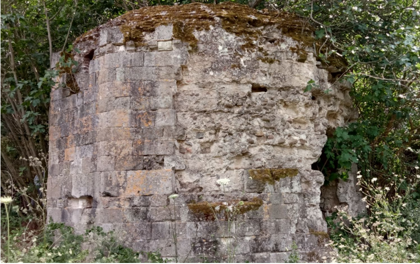
Resim 2: Türbenin kuzeydoğudan görünümü.

Onbirgen planlı gövdeye sahip türbe, küfeki kesme taş kaplamalı, kabayonu taş malzeme dolguludur. (Res. 2)