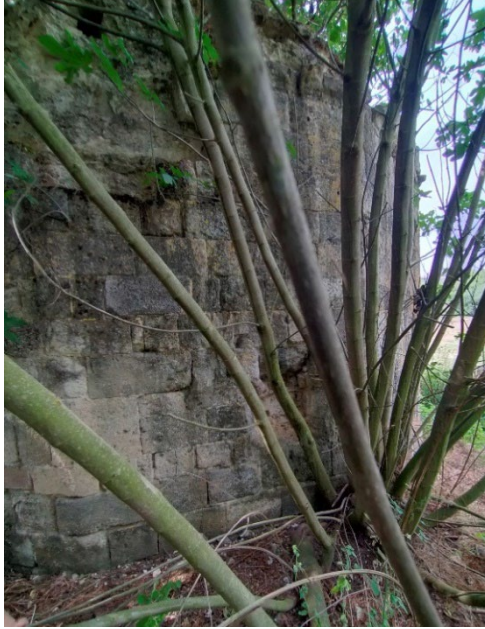
Resim 4: Güneydeki kenarlardan birinin ortasında yer alan silmelerin oluşturduğu çerçeve.

Yapıya giriş kuzey yöndeki açıklıkla sağlanmaktadır. (Res. 5) Türbenin asıl girişinin kuzey kenar üzerindeki bu açıklık olup olmadığı şüphelidir çünkü aynı kenarın batısındaki bitişik dış kenar üzerinde, silme şeritlerinin uzandığı seçilebilmektedir. Bir çerçeve oluşturacak şekilde silmelerle hareketlendirilmiş bu kenar üzerinde yapının asıl girişinin yer alması ihtimal dahilindedir. İçeriden yıkıntının oluşturduğu bir açıklıkla geçilebilen bu kenar, (Res. 6) sonradan moloztaş yığınyla kapatılmış gibi görünmektedir. (Res. 7)