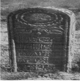
Fotoğraf 6: Kazakistan Millî Müzesinde yer alan 1924 tarihli bir kabir taşı /Almatı.