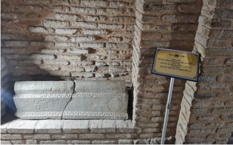
Fotoğraf 9: Mangıstav bölgesinde yer alan bir kabir taşı [Kaynak: Tasmağambetov 2002: 280].