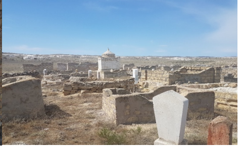
Fotoğraf 10: Hoca Ahmet Yesevî Türbesindeki bir kabir taşı / Türkistan.