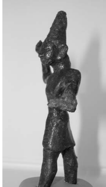
Fig. 7 Heykelcik, yandan