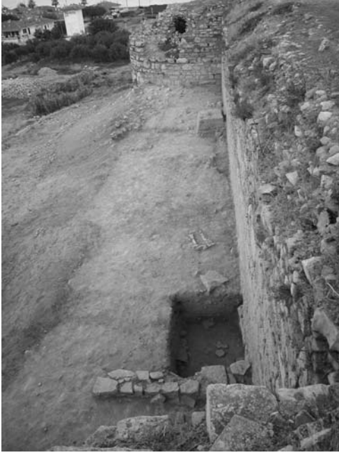
Fig. 4 Heykelciğin bulunduğu alan