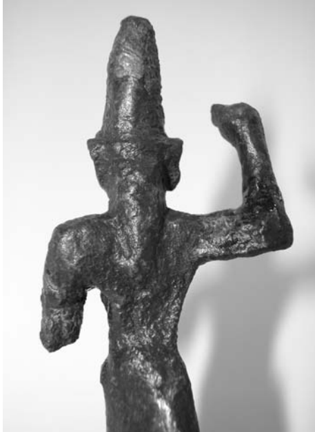
Fig. 6 Heykelcik, arkadan