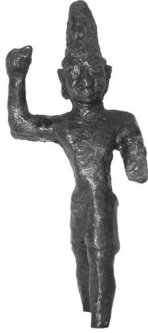
Fig. 5 Heykelcik, cepheden