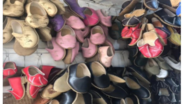
Fotoğraf 26. Farklı renklerde yemeni örnekleri (Kılıç Karatay, 2019)

Yemeniler günümüz modasına renk ve desen bakımından uyum sağlamaktadır. Örneğin eskiden sadece nar kırmızısı, siyah ve boz renk diye üç renk olan yemeni günümüzde hemen hemen her renkte üretilmektedir. Teknoloji yemeni sanatında da etkili olmuştur. Günümüzde yemeni yapımı için kullanılan derilerin renklendirilmesinde kimyasal boyalarda kullanılmaktadır.