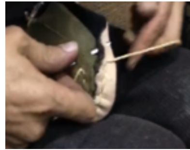
Fotoğraf 16. Kösele ile üstlük kısmının dikilerek birbirine Tuturulması (Kılıç Karatay, 2019)