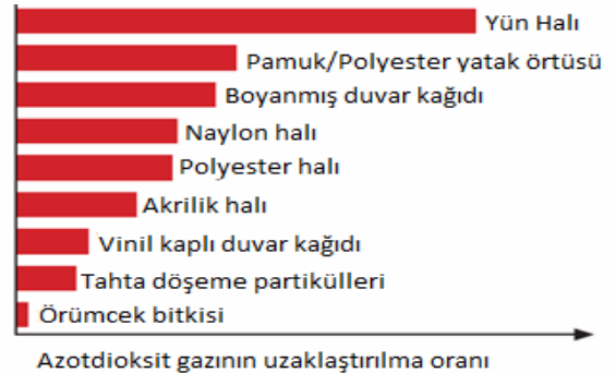
Şekil 1. Çeşitli malzemelerin NO 2 'yi uzaklaştırma oranları [36]

Ancak halılara uygulanan bitim işlemlerinde kullanılan kimyasallar, küfler-kirler, halının arka yüzünde kullanılan bağlayıcılar İHK'ya negatif yönde etki yapmaktadır. Halının partikülleri tutma özelliği yün lifinin kirletici gazları adsorbe etme özelliği ile birleşince oldukça etkili sonuçlar alınabilmektedir. Örneğin, Yeni Zelanda'da araştırmacılar yün halıların ortam içinde üretilen formaldehit miktarını azalttığını ve 4 saat gibi bir sürede yün halının, ortamda bulunan yüksek miktarda formaldehit ve azot oksit içeriğini neredeyse sıfırladığını göstermişlerdir. Sentetik liflerle üretilen halılarda ise yün halıların yarısı kadar etki gözlenmiştir. Azot dioksit için yün ve sentetik lifleri kullanılan halılar ile ilgili yapılmış çalışmalarda da formaldehit için elde edilen sonuçlara benzer sonuçlar elde edilmiştir [36]. Şekil 1'de çeşitli malzemelerin NO 2 'yi uzaklaştırma oranları verilmiştir.