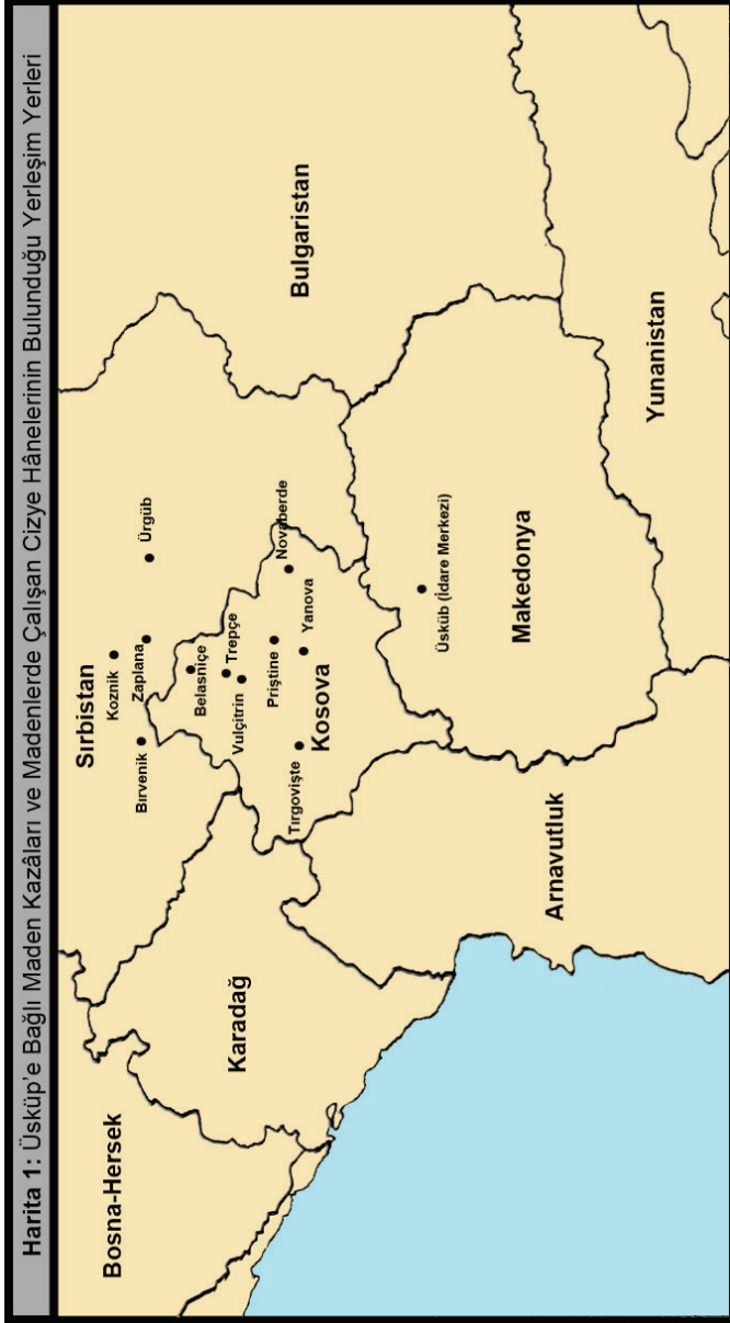
Harita: Maden Kazaları (1075/1664-1665 ve 1099/1687-1688 Yılları).