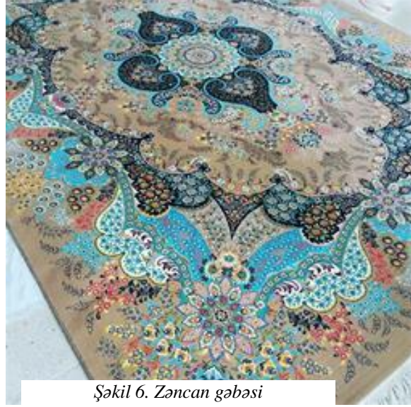
Şəkil 6. Zəncan gəbəsi

Rza şahın hakimiyyətə gəlməsi xalça sənayesinə xarici sərmayələrin azalmasına gətirib çıxardı. 3 fevral 1936-cı ildə Pəhləvi hökuməti, Kirman, Ərak və Həmədanda fəaliyyət göstərən Şərq Xalçası İstehsalat Şirkətinin (ECMC) bağlanmasını əmr etdi və aktivlərini yeni yaranan İran Xalça Şirkətinə köçürdü. Hökumət sintetik anilin boyalarının