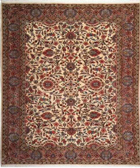
Şəkil 1. Müxtəlif fitorəsmələri əks etdirən Həmədan xalçası