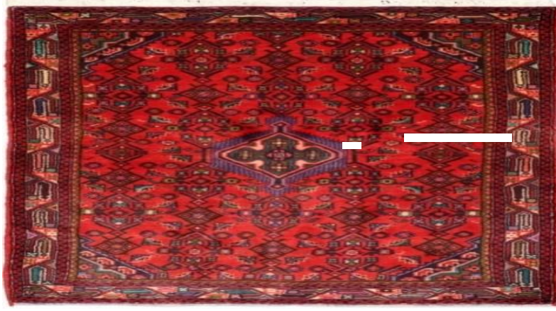
Şəkil 5. Həmədan xovlu xalçası

Zəncan xalçaçılıq sahəsində inkişaf etmiş əyalətlərdən olsa da, təəssüf ki, bu barədə kifayət qədər yazılı əsərlər və onun haqqında ətraflı məlumat yoxdur. Bu barədə yazılı sənədlər bəzi