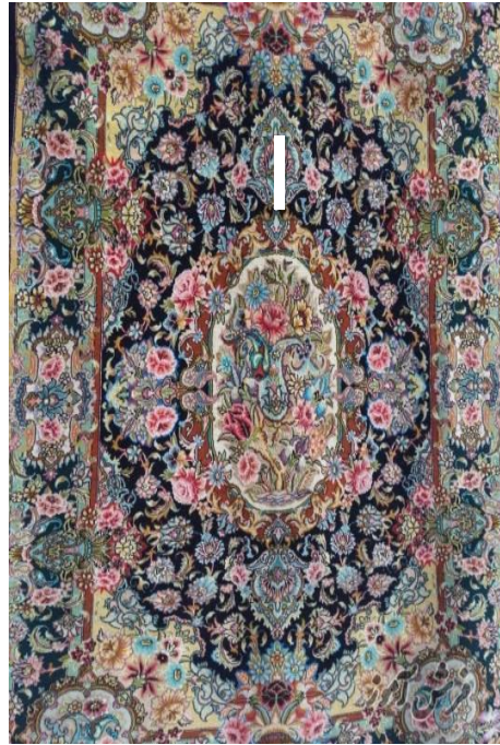
Şəkil 4. Zəncan xalçaçılıq məktəbinə aid əl xalçası

Mürəkkəb keçirtmə texnikası ilə hazırlanan güllü palazın ərş taylarını aralamaq üçün ümumi dal ağacı əvəzinə qısa çilik işlənirdi. Cərgə ilə çin-çin toxunan ilmə və ya boya-boy keçirilən arğac iplərindən fərqli olaraq, güllü palazın bəzək ipləri naxış ünsürünü müstəqil toxuyan hər bir qadının qarşısındakı, ərş taylarının arasında çilik vasitəsilə keçirilib toxunurdu. "Dolama", yaxud dərmə texnikası ilə birüzlü toxunan kilimlərdə naxış ünsürü ilmə sayaqı rəngbərəng boyanmış xüsusi bəzək ipinin köməyi ilə əmələ gətirilirdi. Naxışın müvafiq hissələrinin rəng uyarının tələbindən asılı olaraq bəzək iplərinin sərbəst ucu, bir qayda olaraq, məmulatın, astarüzünə çıxarılırdı. 13