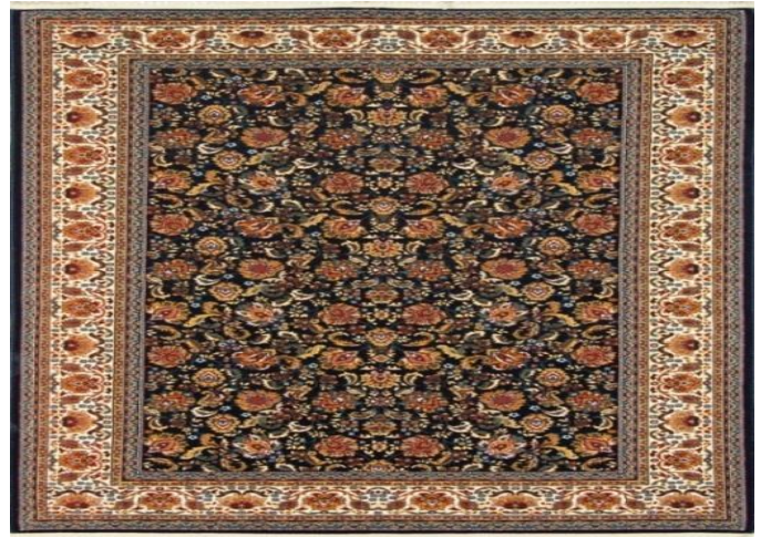
Şəkil 3. Gül-çiçək ornamentli xovsuz xalça (Həmədən)

Canamaz xüsusi olaraq namaz qılanlar üçün nəzərdə tutulduğundan xeyli kiçik ölçüdə toxunurdu. Onun uzunluğu, adətən, 1 arşın, eni 3 çərək ölçüdə olurdu. Çox nadir halda Cümə məscidləri üçün "səf səccadə" adlanan çox böyük ölçüdə namazlıq xalça toxunurdu. Fərdi səciyyə daşıyan "canamaz" in fərqləndirici əlamətlərindən biri də bundan ibarət idi. Azərbaycanın başlıca xalça istehsalı mərkəzlərinin hamısında onun