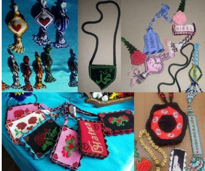
Resim 11. Çift Örgü Tekniği İle Yapılmış Hediyelik Ürünler (Cezaevi İş Yurdu ile Ürün ve El sanatları Fuarı)