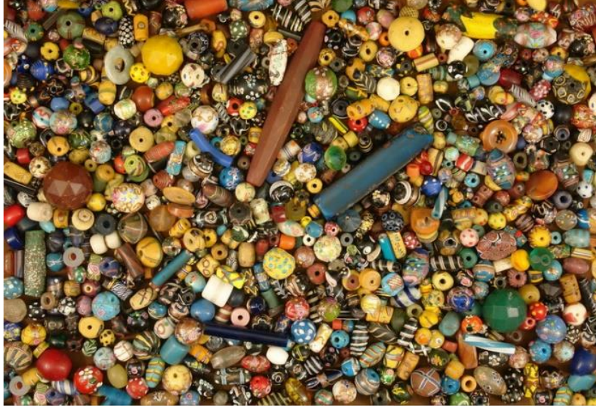
Resim 1. Ticaret Boncukları

Boncuklar eski zamanlardan beri aksesuar ve giysilerin dışında ayakkabılarda da kullanılmıştır. Boncuk kullanılarak yapılan ayakkabı sayaları doğudan batıya, kuzeyden güneye birçok ülkede ve Türkiye’de görülmektedir. Boncuk ile oluşturulan sayaların yapım tekniği; model ve kullanım şekli, iklimsel özellikler ile sosyal ve kültürel unsurlara göre değişmektedir. Sibiryaya, Kuzey Amerika ve Grönland Eskimoları çizmelerini boncuk işleri ile süslemiştir. Malezya, Çin, İran, Hindistan, Endonezya, Malezya ve Nijerya’ya kadar dünyanın birçok yerinde, farklı biçimlerde çeşitli boncuklardan yapılmış sayalardan ayakkabılar görülmektedir.