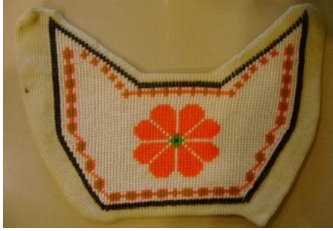
Resim 9. Terlik Sayası 2

Üçüncü örnekte diđer sayalarda olduđu gibi zemin beyaz boncuktan örlmüŖtür. Gül motifinde sarı ve kırmızı, yapraklarda yeŖil renkli boncuk kullanılmıŖ, terliđin iç ve dıŖ ađız kenarlarındaki köŖelere lale motifi yerleŖtirilmiŖtir. Desenin çevresi fotoğraf 8’de görölen örnekte gibi siyah boncukla sınırlandırılarak kompozisyonu tamamlanmıŖtır. İstanbul Cezaevinde örlölen saya, Resim 10’da görölmektedir.