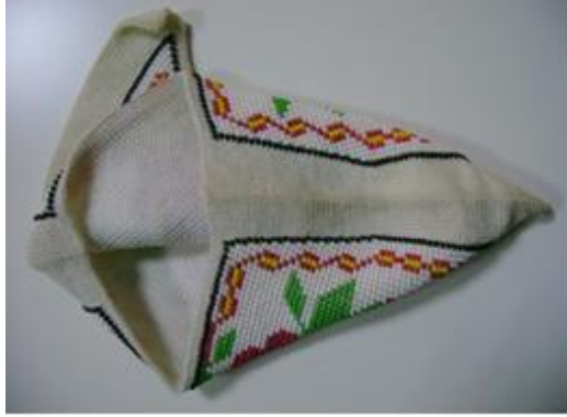
Resim 7. Terlik Sayası (Akbacakoğlu Koleksiyonu, Somçağ:2015)

İş yurdunda çalışan hükümlüler, fuarlarda sergilenmek ve cezaevi satış mağazaları için küçük hediyelik eşya örmekte iken “ayakkabı sayalarını sipariş üzerine istenilen formlarda ördüklerini, uzun yıllardır nadiren sipariş alındığını” ifade etmişlerdir. Tutuklu ve hükümlülerden alınan bilgilere göre yaptıkları ürünler ile hapisane işi sayanın aynı teknik ve yöntemle örüldüğü tespit edilmiştir. Aynı tekniğin kullanılması yoluyla dikiz aynası süsü, anahtarlık, kalemlik, bozuk para cüzdanı gibi küçük hediyelik eşya yapıldığı belirlenmiştir.