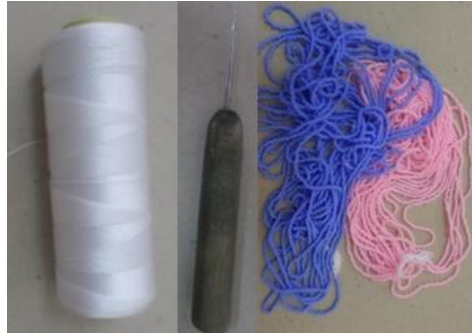
Resim 3. İplik, Tığ ve İnci Boncuk Dalları (Cezaevi İş Yurdu, Somçağ:2015)

Hammaddesi sentetik olan iplikler, parlak, çeşitli kalınlıkta ve renklerde olmaktadır. İstenilen örgü sıklığına göre naylon ipliklerin bükümü ve kalınlığı değişmektedir. 4 numara iplik ile yumuşak bir yüzey elde edilirken 6 numara iplik ile orta sertlikte örgüler ortaya çıkmakta, 8 numara iplik ile daha sert örgüler yapılmaktadır. Tutuklu ve hükümlüler, “ 8 numara iplik ile yapılan örgülerin kaba görüldüğü için tercih etmediklerini, 4 numaralı iplik ile örülenlerin ise tam tersine zayıf görüldüğünü ve ipliğin ince olmasından örgünün yavaş ilerlediğini belirterek, çoğunlukla 6 numara iplik kullandıklarını” ifade etmişlerdir. Hükümlüler, “Beyaz renk ipliği boncuk renklerine uyum sağladığı ve rahatlıkla görebildikleri için tercih ettiklerini, siyah rengi görmekte zorlandıklarını” da belirtmişlerdir.