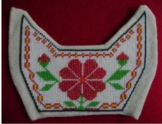
Resim 8. Terlik Sayası 1

Resim 8’de verilen ilk örnek, diğerleri gibi sık (basit) ilmek ile beyaz renkte iplik ile çift katlı olarak Afyonkarahisar cezaevinde örülmüştür. Boncukların beyaz, kırmızı, sarı, yeşil ve siyah renkleri kullanılmıştır. Burnu açık yapılan sayanın ortasından kısa bir dal üzerinde sekiz yapraklı çiçek motifi, motifin her iki tarafından çıkan dallarda yeşil yaprak ve tomurcuklar görülmektedir. Kompozisyon motiflerin çevresini saran sarı ve kırmızı renklerde bordür ve bir sıra siyah boncuklar ile tamamlanmıştır.