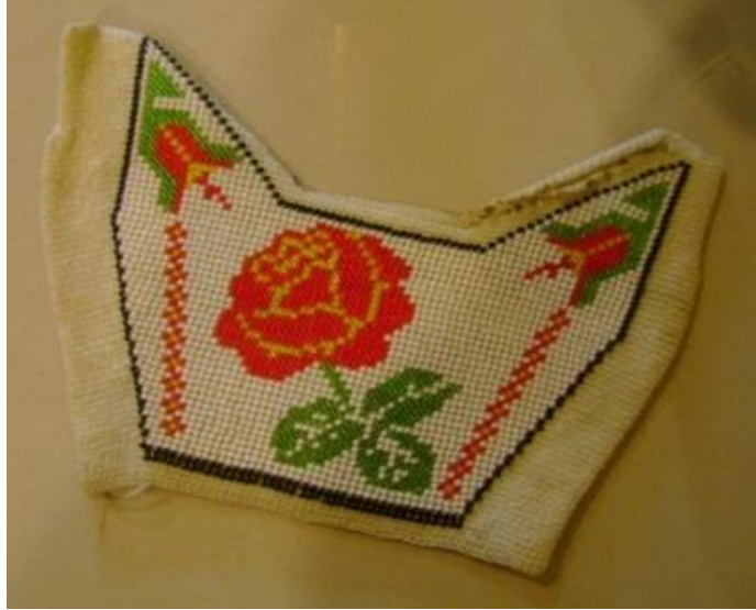
Resim 10. Terlik Sayası 3

Üçüncü örnekte diđer sayalarda olduđu gibi zemin beyaz boncuktan örlmüŖtür. Gül motifinde sarı ve kırmızı, yapraklarda yeŖil renkli boncuk kullanılmıŖ, terliđin iç ve dıŖ ađız kenarlarındaki köŖelere lale motifi yerleŖtirilmiŖtir. Desenin çevresi fotoğraf 8’de görölen örnekte gibi siyah boncukla sınırlandırılarak kompozisyonu tamamlanmıŖtır. İstanbul Cezaevinde örlölen saya, Resim 10’da görölmektedir.