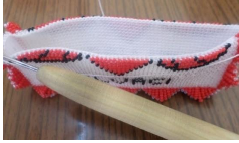
Resim 6. Sık İlmek Tekniği ile Çift Katlı Örgü (Cezaevi İş Yurdu, Somçağ:2015)

Cezaevlerinde Boncuk İşi Yapımı.... The Meric Journal Cilt:6, Sayı:15,Yıl:2022 açık olarak bırakılmaktadır. Örgüler iki katlı örüldüğünden torba görünümündedir. Resim 6’da Sincan cezaevi iş yurdunda bir hükümlünün çalıştığı ürün görülmektedir. Ürün cüzdan olarak yapılmakla birlikte saya ile aynı teknikte örülmekte, sadece biçim ve boyut farklı olmaktadır.