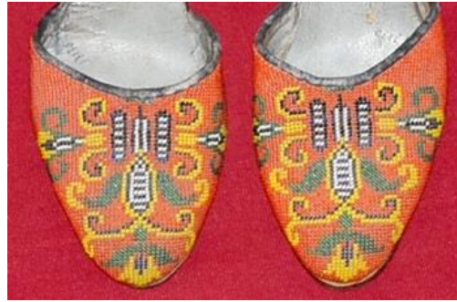
Resim 2-c. Kadın Çizmesi