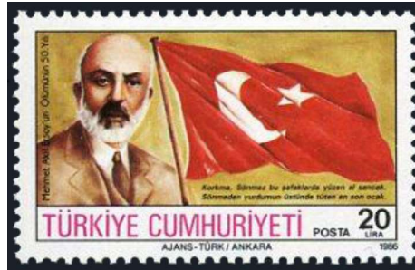
Görsel 4: Mehmet Akif Ersoy'un Ölümünün 50. Yılı, 41x26 mm (URL-1).

dördüncü satırı olan “ Hakkıdır hür yaşamış bayrağımın hürriyet ” ibaresine yer verilmiştir.