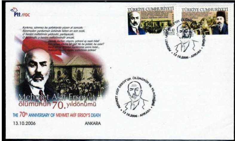
Görsel 7: Türkiye, Mehmet Akif Ersoy'un Ölümünün 70. Yıldönümü Temalı İlk Gün Zarfı ve İlk Gün Damgası 41x26 mm (URL-4).