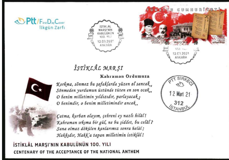
Görsel 10: Türkiye, İstiklal Marşı'nın Kabulünün 100. Yılı Temalı İlk Gün Zarfı ve İlk Gün Damgası 200x140mm (URL-7).