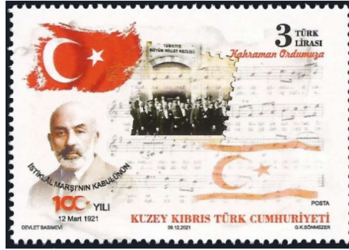
Görsel 11: Kuzey Kıbrıs Türk Cumhuriyeti İstiklal Marşı'nın Kabulünün 100. Yılı , 52x36 mm (URL-8).

Türkiye, Kuzey Kıbrıs Türk Cumhuriyeti ve Türkiye-Pakistan diplomatik ortaklığıyla gerçekleştirilen pul tasarım çalışmaları, millî şairin vefatının yirminci, ellinci, yetmişinci ve yüzüncü yılı anısına tedavüle çıkarılan tasarımlardan oluşmaktadır.