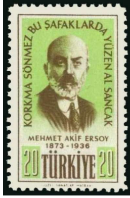
Görsel 1: Mehmet Akif Ersoy'un Ölümünün XX. Yılı.