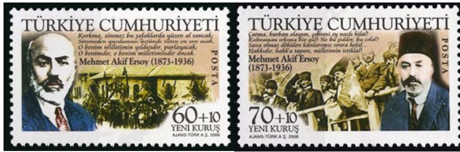
Görsel 5: Mehmet Akif Ersoy'un Ölümünün 70. Yıldönümü, 41x26 mm (URL-2).

Görsel 5'te 2006'da Mehmet Akif Ersoy'un Ölümünün 70. Yıldönümü anısına tedavüle çıkarılan ek değerli pullardan ilkinde yer verilmiştir. Baskı sayısı 200.000 olan bu pulların grafik tasarımcısı Bülent Ateş'tir (Pulhane, 2006). Yatay bir kompozisyonun tercih edildiği bu çalışmada, solda kalan ¼'lük alana Mehmet Akif Ersoy'un portresi, sağda kalan ¾'lük alana I. Türkiye Büyük Millet Meclisi ve hemen üstüne ise İstiklal Marşı'nın ilk kıtası konumlandırılmıştır. Mavi çizgili ceket giyen şair, kırmızı renk tonunda ekoseli bir de kravat takmıştır. Siyah bıyıklı ve beyaz sakallı olan şair düşünceli bir biçimde hafiften sola doğru bakmaktadır. Tasarımın altın oranına şairin adı