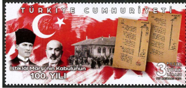
Görsel 9: Türkiye, İstiklâl Marşı'nın Kabulünün 100. Yılı Temalı Tasarım, 79x36 mm (URL-6).

Görsel 10'da 12.03.2021'de İstiklâl Marşı'nın Kabulünün 100. Yılı anısına tedavüle çıkarılan ilk gün zarfıyla ilk gün damgasına yer verilmiştir. Tedavüle çıkarıldığı günkü satış fiyatı 10 TL olan bu tasarım, varak uygulamalı baskı yöntemiyle, 2.500 adet olarak üretilmiştir. 200x140 mm ebadında ölçülendirilen zarfın grafik tasarımcısı Hakan Mazlum'dur (Pulhane, 2021). Yatay bir kompozisyonun tercih edildiği bu tasarımda solda İstiklâl Marşı'nın 1. ve 2. mısraları ile Türk bayrağını dikmeye çalışan üç kişiye yer verilmiştir. Hemen altına İstiklâl Marşı'nın Kabulünün 100. Yılı ibaresinin Türkçe ve İngilizce karşılığı konumlandırılmıştır. Tasarımın sağında ise görsel 9'da yer alan ve aynı seride tedavüle çıkarılan bir pula yer verilmiştir. Görüldüğü üzere damgalardan biri direk pulun üzerine, diğeri ise ilk gün zarfının üst kısmında yer alan açık alana tatbik edilmiştir. Ayrıca İstiklâl Marşı'nın Kabulünün 100. Yılı ibaresi ile ilk gün zarfının tedavüle çıkarıldığı yer ve işlem tarihi hakkında bilgiler sunan ilk gün damgası; gül motifi, yazı metni ve damgaya oval bir görünüm kazandıran iki adet divit ucuyla birlikte betimlenmiştir.