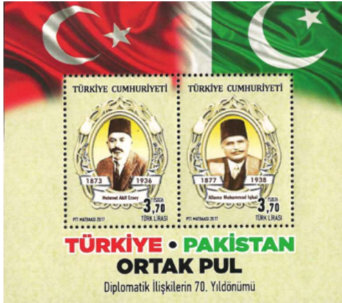
Görsel 8: Türkiye Pakistan Ortak Pul Tasarımı, 91x90 mm (URL-5).

Mehmet Akif, Pakistan'ın bağımsızlığını elde etmesinde öncü rol üslenen Şair Muhammed İktbal'in eserlerine ilgi duymaktadır. Hatta Mısır'da bulunduğu sıralarda Muhammed İktbal'le görüşme imkânı bulur. Bir araya gelen iki şair, İslam dünyasının içinde bulunduğu durum hakkında karşılıklı değerlendirmelerde bulunurlar (Kahraman, 2021: 23). Görsel 8'de 2017'de Türkiye-Pakistan Ortak Pul-Diplomatik İlişkilerin Kurulmasının 70. Yıldönümü anısına tedavüle çıkarılan ve iki puldan oluşan anma bloğuna yer verilmiştir. Baskı sayısı 100.000 olan bu pulun grafik tasarımcısı Kamil Mersin'dir (Pulhane, 2017). İki farklı pulun bir seride birleştirilmesiyle oluşturulan kompozisyonda, sağa Muhammed İktbal ve Pakistan'ın ulusal bayrağı, sola ise Mehmet Akif ve Türk bayrağı konumlandırılmıştır. Her iki resim, portre biçiminde tasarlanarak oval bir çerçeveye yerleştirilmiştir. Çerçevenin soluna doğum, sağına ise vefat tarihleri eklenmiştir. Portrenin hemen altında bulunan beyaz alana, her iki şairin isimleri yazılmıştır. Tasarımda dikkat çeken bir diğer detay Türkiye'nin kırmızı, Pakistan'ın ise yeşil renk tonuyla tasvir edilmesidir.